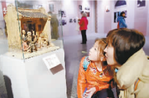
1月23日,中华家风文化主题展在北京中华世纪坛拉开帷幕。

重庆市是老工业基地,但近些年的转型发展,也让重庆工业焕发着新活力。在表现老工业情怀的同时,如何描绘好新工业时代,成了艺术家们必须思考的问题。