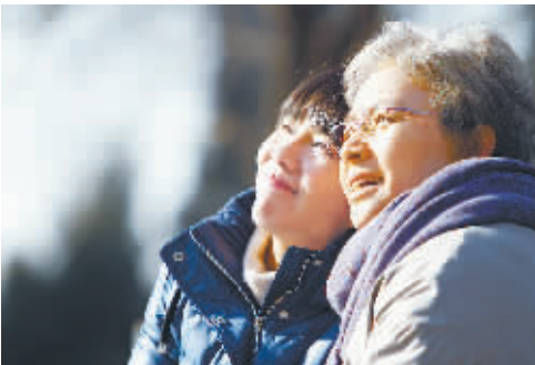
电视剧《妈妈的花样年华》剧照。

在穆光宗看来,老年题材影视化是值得重视的文化工程,也是丰富老年人精神文化生活的重要举措。因此应呼吁社会多多关注。但是应该意识到,老年题材影视化本身还有一个市场化选择的过程,需要找到社会化和市场化的折中点,更需要时间成长,“为此,我们还需要一点耐心和爱心。”