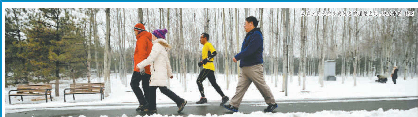
奥森公园是跑步爱好者的理想去处。视觉中国 供图

随着跑步热升温,寒冷的冬天也挡不住跑者的脚步,但缺乏运动常识让一些人快乐并痛着——