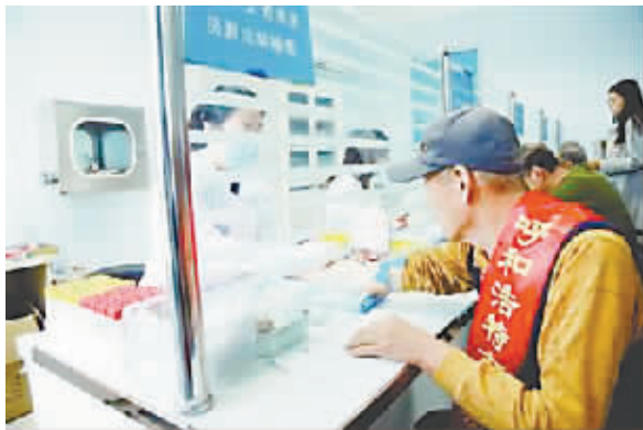
内蒙古自治区总工会组织劳模体检

京津冀蒙工会跨区域促进就业创业系列活动等一系列帮扶行动,发挥139个帮扶中心、2710个帮扶站点和2736家爱心驿站以及职工培训基地、职业介绍机构等的作用,为困难职工提供全方位的帮扶救助。