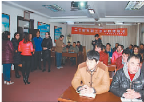
内蒙古各级工会开展技能培训促就业活动,培训职工68667人