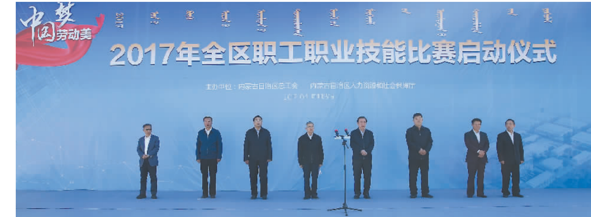
2017年内蒙古自治区总工会举办了87个工种的自治区职工职业技能比赛