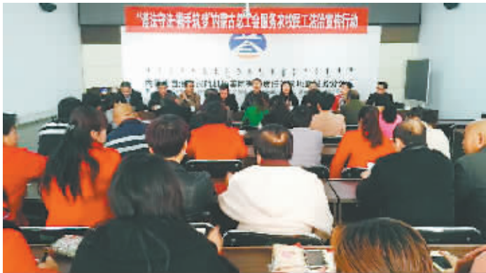
内蒙古自治区总工会开展“遵法守法·携手筑梦”服务农牧民工法治宣传行动