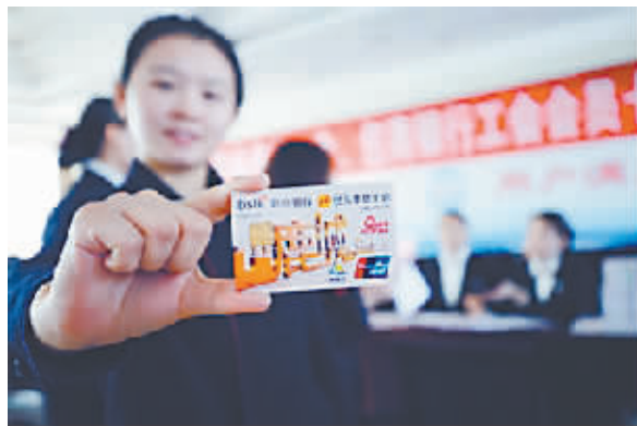
大力推进工会会员普惠工作

2017年全区各级困难职工帮扶中心共筹集资金1.6亿元,帮助20066户困难职工家庭实现脱困。内蒙古自治区总工会把“精准”贯穿困难职工解困脱困全过程,整合内外资源、协同发力提升解困脱困效果,落实创业就业技能一批、纳入社会保险覆盖一批、大病保险保障一批、社会救助兜底一批“四个一批”的困难职工帮扶措施。内蒙古各级工会开展送温暖、金秋助学、工会就业援助月、