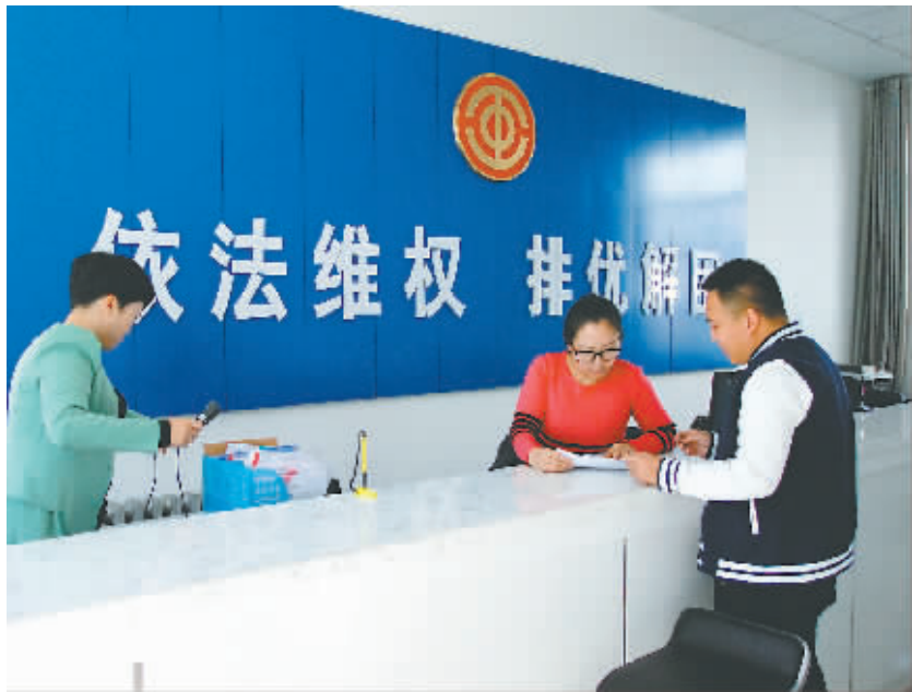
帮扶中心已经成为职工真正的娘家