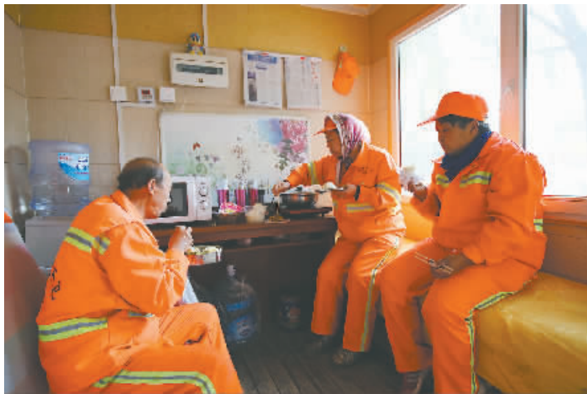
内蒙古已建成环卫工人爱心驿站(点)3963家,图为环卫工人在爱心驿站使用微波炉热饭