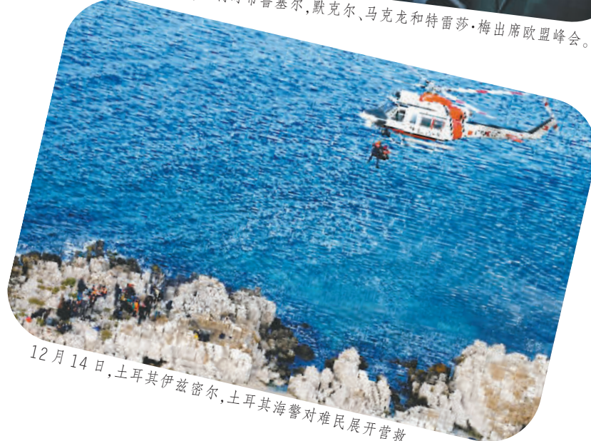
12月14日，土耳其伊兹密尔，土耳其海警对难民展开营救。