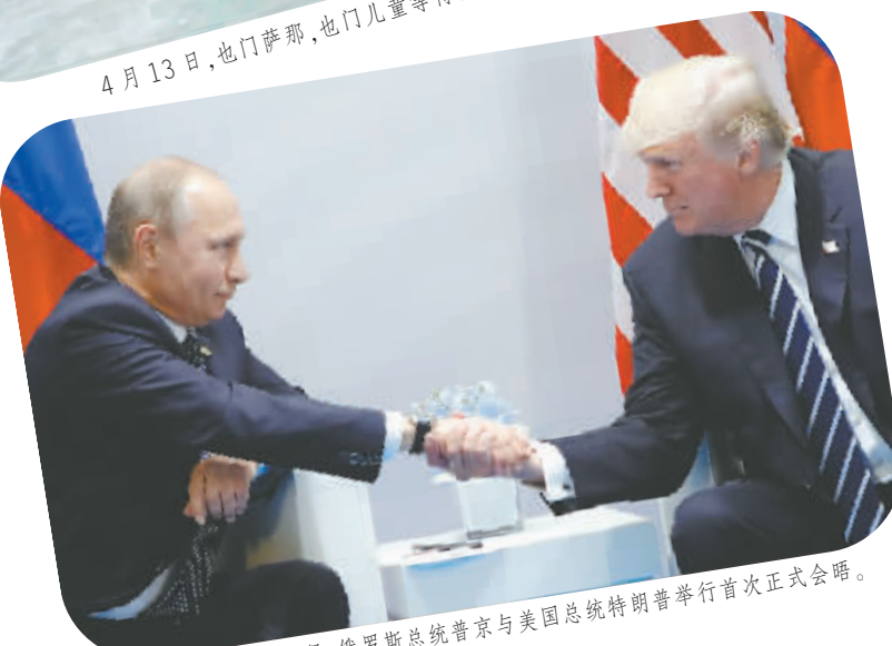
7月7日，德国汉堡，俄罗斯总统普京与美国总统特朗普举行首次正式会晤。