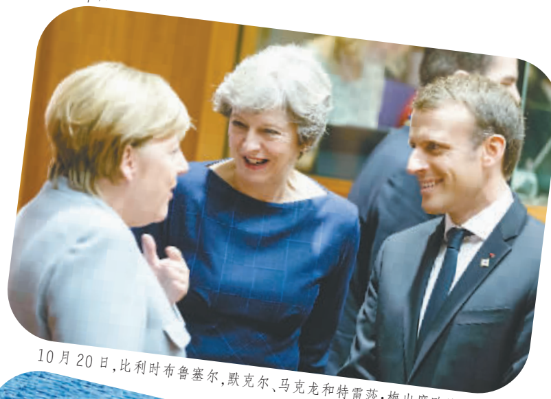
10月20日，比利时布鲁塞尔，默克尔、马克龙和特朗普出席欧盟峰会。