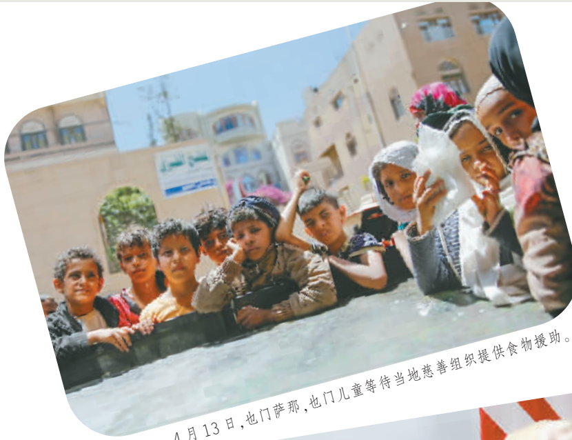
4月13日，也门萨那，也门儿童等待当地慈善组织提供食物援助。

美国与委内瑞拉之间则发生多次外交摩擦。美国不仅通过美国国家组织向委政府施压，还对委实施一系列经济金融制裁，甚至扬言要进行军事干预，委国内经济因此受到很大影响。不过委执政党通过成立制宪大会，在地方选举中取得压倒性胜利等举措牢牢掌控了国内局势，反对党也同意回归与政府的对话。