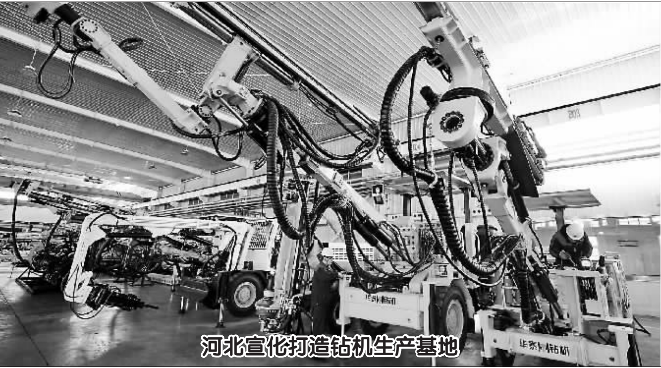
12月18日,工人在张家口市宣化区钻机产业园区内的一家钻机企业工作。

应该如何看待大学毕业生的求职花销?中国人民大学招生就业处刘老师向记者表示:“大学生的求职成本主要有资料费、面试服装费、通讯费、报名培训费等,也包括一些不合理的收费。目前就业形势复杂严峻,各高校毕业生之间竞争十分激烈,大学生找工作的成本也随之水涨船高。” 刘老师认为,应该理性看待应届生的求职花销。“大学生离开校园进入社会找工作,衣食住行都要花钱,这在所难免,参加一些正规的培训也没有什么不妥。这些属于毕业的成本支出,家里也应该在经济上给予支持。”刘老师告诉记者,“但是,毕业生千万不要为了面子而过度包装自己,这样不但会让家庭不堪重负,往往还会适得其反。因为面试官最在意的还是你的个人素质和能力,不是外表。毕业生要正确认识自己,少一些盲目,多一些理性。”