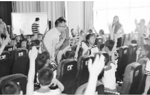
共产党员服务队进校园宣传安全用电知识

国网霍林郭勒市供电公司党委下设两个基层党支部,第一党支部,第二党支部均成立于2016年5月17日。其中,第一党支部现有党员14人,第二党支部现有党员17人。一直以来,公司党委在霍市市委、通辽供电公司党委的正确领导下,紧紧围绕企业中心工作,坚持以“四个服务”宗旨和“三严三实”专题教