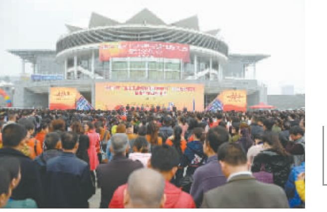
2017年2月8日,全国工会就业创业援助月活动启动仪式在南宁举行