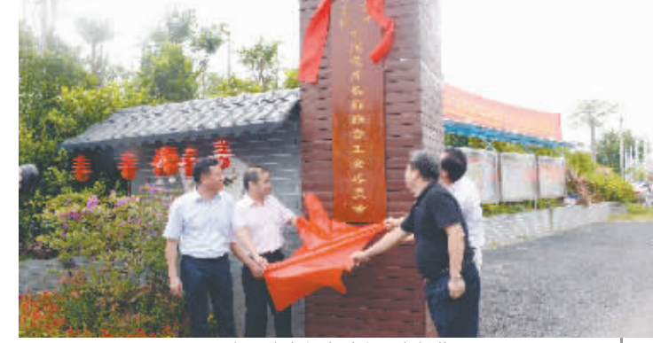
十里花卉长廊联合工会揭牌

南宁市总工会认真贯彻落实上级工会部署,集中开展“加强基层工会建设年”活动和“强基层、补短板、增活力”行动,学习借鉴上海金山区顾村镇建会经验,把非公企业作为夯实基层的切入点和着力点,特别突出抓好工业园区、建筑项目工地、快递业、农家乐、农业产业化地区等行业产业和25人以下企业的工会建会工作。 一是建立区域性工会联合,拓展基层工会建会领域,动员