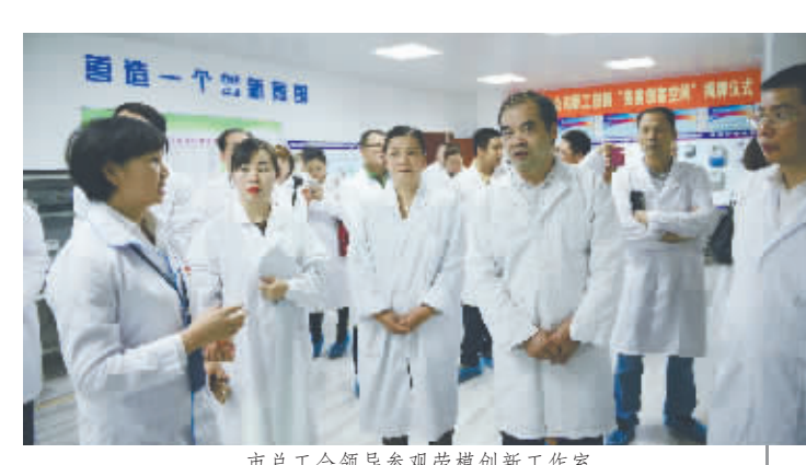
市总工会领导参观劳模创新工作室

进一步发挥南宁市劳模、技术标兵创新工作室在推动企业转型升级、技术创新、提质增效中的引领示范作用。南宁市总工会根据实际情况,整合全市劳模、技术标兵创新工作室资源,创立全区首个劳模创新工作室工作联盟,实现创新工作室的集群效应,为全市企事业创新发展提供技术支撑和人才保障。 一是创新模式,创立全区首个劳模创新工作室工作联盟。根据中华全国总工会《关于进一步深化劳模和工匠人才创新工作室创建工作的意见》(总工发[2017]13号)文件精神,结合实