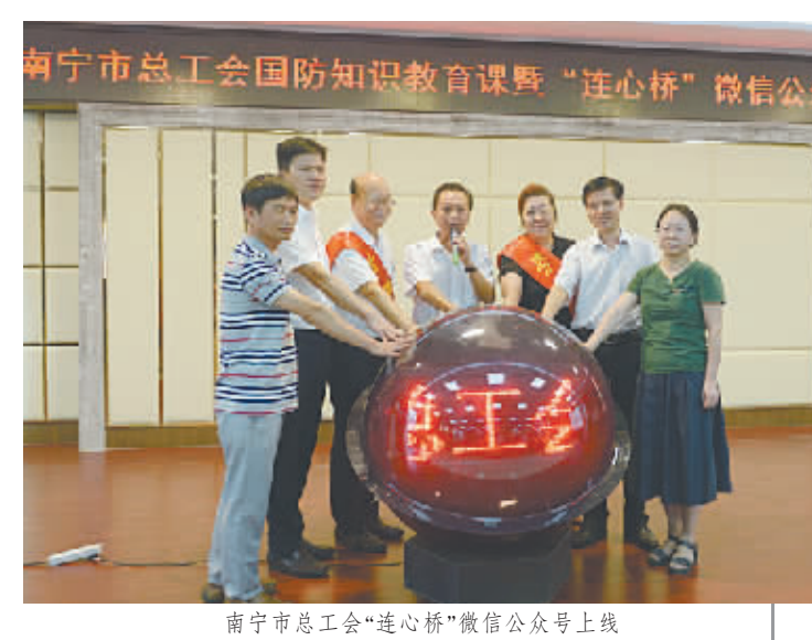
南宁市总工会“连心桥”微信公众号上线

根据中华全国总工会印发《全国工会网上工作纲要(2017年-2020年)》要求,南宁市总工会推进工会网上工作平台建设,树立以信息科技创新工会工作发展的理念,立足工会职能,增强服务功能,努力构建线上受理、线上线下办理、一键通达的全方位、全时段服务职工体系,创建统一完整、功能完善、安全可靠、技术先进的“网上工会”工作平台,实现“网上有需求、上下有服务、网上有声音、上下有行动、网上有培训、上下有实操、网上有窗口、上下有内容”的工会工作新格局,让广大职工群众能够随时随地实现“一掌知工会”,享受“一站式服务”。