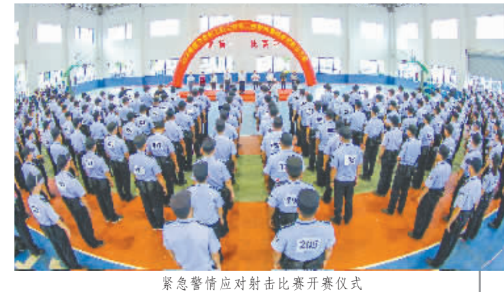
紧急警情应对射击比赛开赛仪式

南宁市总工会创新性地开展了职工经济技术创新建功立业活动,职工职业技能大赛建立“三级联赛模式”(分市级、县(区)级、行业企业三级联赛),真正把技能大赛办到职工家门口。2017年南宁市职工职业技能大赛拓展新领域,工种设置更加合理实用,共设36个工种(项目),大赛的主题是“扬工匠精神 展技能风采”。今年大赛的特点:一是面向公共服务,更加贴近民生,开展基层卫生职业技能、急救技能、电梯维修、电缆故障查找及应急电源快速接入等服务民生的特色比赛;二是根据形势需要,增设比赛工种,如公安武装巡逻车组岗位能