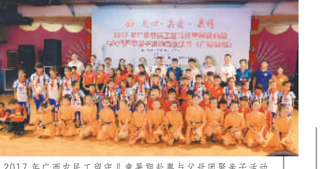
2017年广西农民工留守儿童暑期赴粤与父母团聚亲子活动