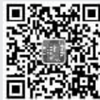
扫描二维码 关注“钟声”,看 工人日报“钟声 君”评论。

“满足人民过上美好生活的新期待,必须提供丰富的精神食粮。”透过“美在新时代”画展中国美术馆前排出的千米长队,透过国家大剧院前出发的“黄牛”,公众对高品质文化演出、展览的饥渴可见一斑。让更多专业及非专业的艺术爱好者有机会沐浴在经典艺术的阳光下,我们还有很多事要做。比如,出品更多原创作品,增加演出场馆、场次,治理演出市场良莠不齐问题,向二、三线城市拓展演出市场,合理定位票价等等。解决这个问题,核心是深化文化体制改革,完善公共文化服务体系。这是党的十九大的战略部署,也是广大百姓的殷切期待。