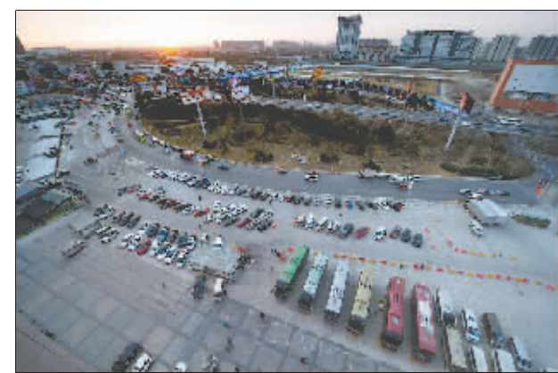
↓11月29日清晨,燕郊东贸广场,这里已经停了不少来自北方各省市的大巴车。