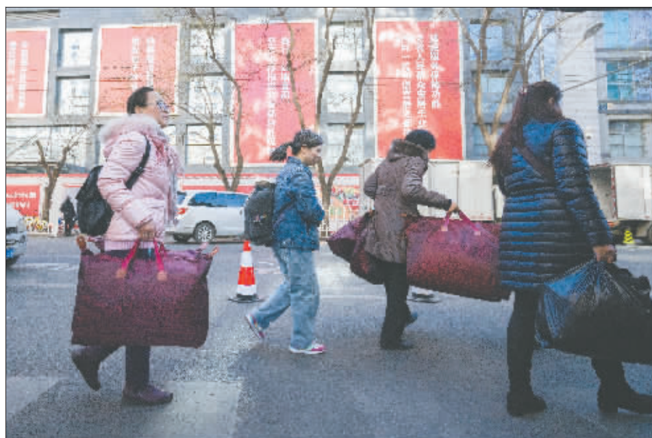
11月30日,几位市民在北京东鼎购买完商品后前往公交站。