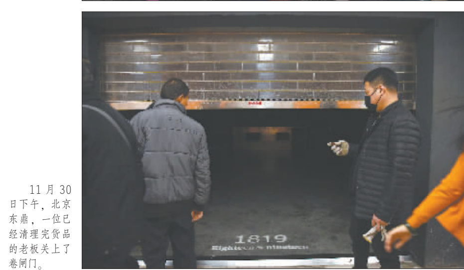
11月30日下午,北京东鼎,一位已经清理完货品的老板关上了卷闸门。