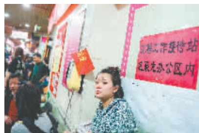
2015年12月31日,位于“动批”的聚龙批发城闭市。为保证疏解顺利,当地管委会在商场内设立了接待站。

11月30日14时刚过,北京动物园批发市场(俗称“动批”)的最后一家——东鼎服装商品批发市场(简称东鼎)关上了大门,这标志着由12家服装市场组成的动批商圈正式告别历史舞台。