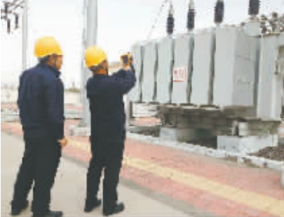
组织运维人员对所辖66kV变电站开展特巡

科左后旗供电公司认真执行“全接线、全保护”电网运行方式安排原则,严格停电计划刚性管理,统一部署控制策略;密切跟踪天气