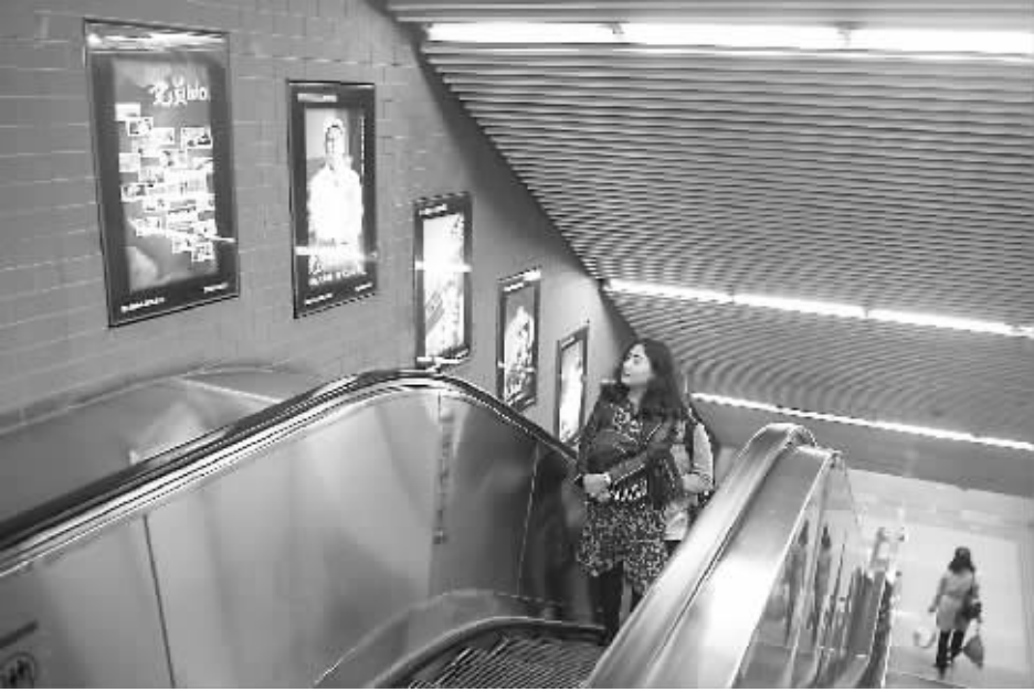
北京什刹海地铁站,一位女乘客正专注地看着“党员 idol”海报。

国资委新闻中心从一大批国企优秀党员中筛选出18位一线代表,并为其量身打造了专属词汇——“党员 idol”,进行集中推广。这18个“党员 idol”是:“筑梦航天赤子心”的张奕群研究室,“精工细雕”的药面整形师徐立平,智造“华龙一号”的总工程师邢继,让“神舟入浩瀚”的载人飞船总设