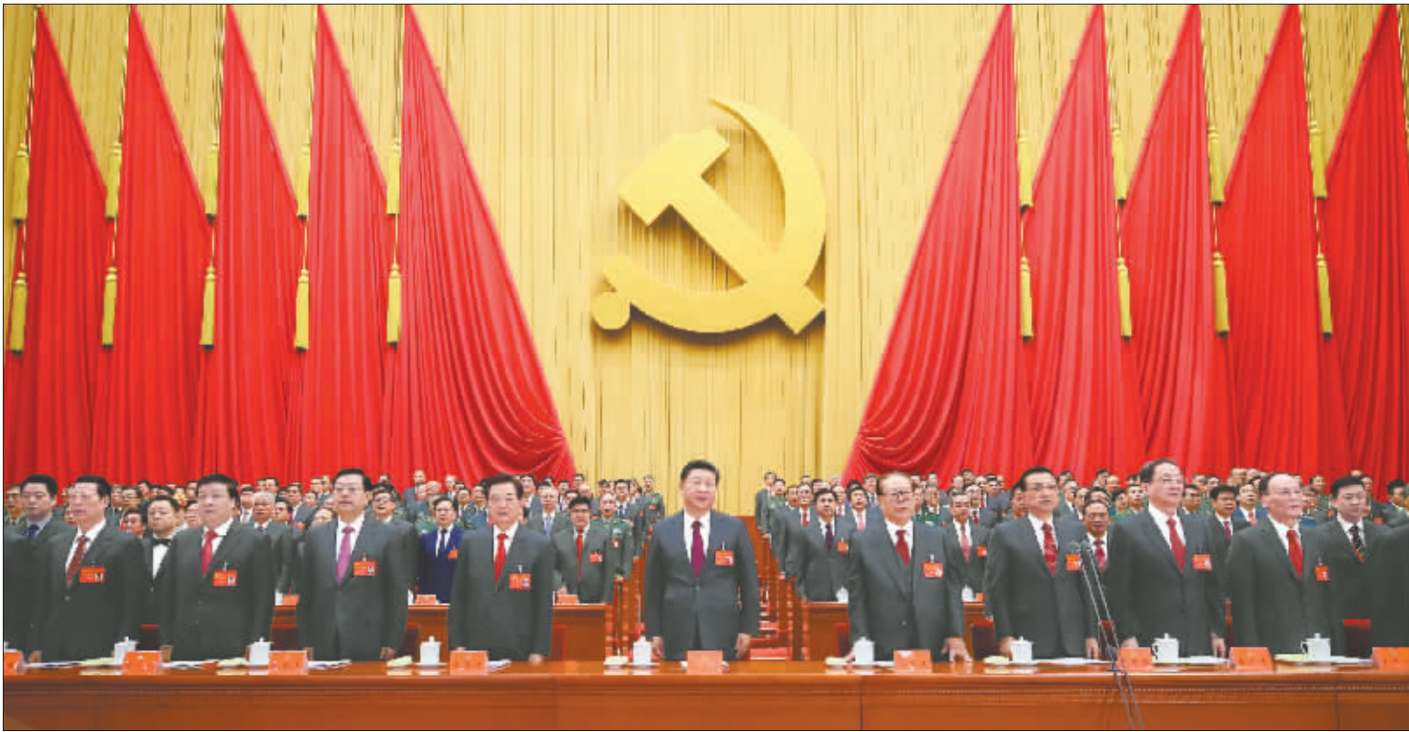
10月18日,中国共产党第十九次全国代表大会在北京人民大会堂开幕。这是习近平、李克强、张德江、俞正声、刘云山、王岐山、张高丽、江泽民、胡锦涛在主席台上。