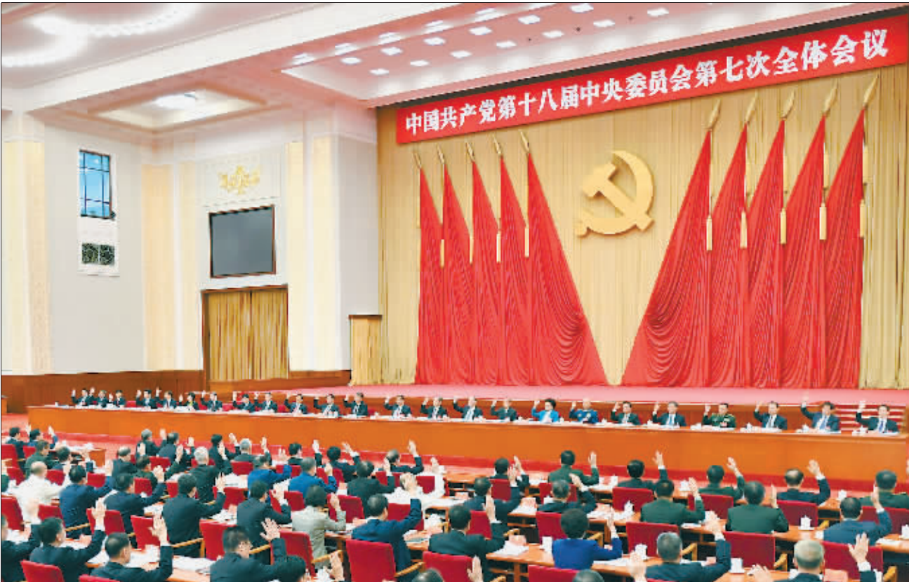
中国共产党第十八届中央委员会第七次全体会议,于2017年10月11日至14日在北京举行。中央政治局主持会议。

新华社北京10月14日电 中国共产党第十八届中央委员会第七次全体会议公报(2017年10月14日中国共产党第十八届中央委员会第七次全体会议通过) 中国共产党第十八届中央委员会第七次全体会议,于2017年10月11日至14日在北京举行。出席全会的有中央委员191人,候补中央委员141人。中央纪律检查委员会委员和有关负责同志列席会议。 全会由中央政治局主持。中央委员会总书记习近平作了重要讲话。 全会决定,中国共产党第十九次全国代表大会于2017年10月18日在北京召开。 全会听取和讨论了习近平受中央政治局委托作的工作报告。会议讨论并通过了党的十八届中央委员会向中国共产党第十九次全国代表大会的报告,讨论并通过了党的十八届中央纪律检查委员会向中国共产党第十九次全国代表大会的工作报告,讨论并通过了《中国共产党章程(修正案)》,决定将这3份文件提请中国共产党第十九次全国代表大会审查和审议。习近平就党的十八届中央委员会向中国共产党第十九次全国代表大会