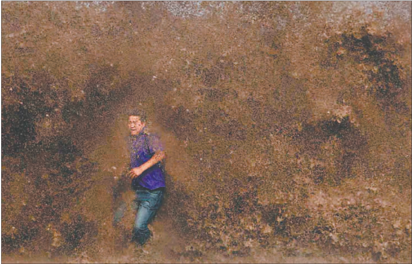
2013年9月9日,杭州,离潮水太近躲闪不及的观潮者。