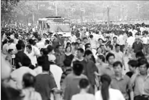
2000年9月15日,(农历八月十八),之江路上的观潮人。