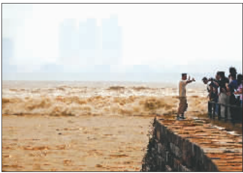
2007年10月29日,海宁,潮水来了!一工作人员招呼观潮人群后退。