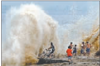
2006年8月13日,海宁,潮水撞击丁字坝掀起巨浪。

“八月十八潮,壮观天下无”。这是北宋诗人苏轼咏赞钱塘秋潮的千古名句。钱塘江两岸观潮习俗由来已久,在《全唐诗》收录的2200多位诗人中,有300多位诗人不远千里亲临钱塘江观潮赋诗。