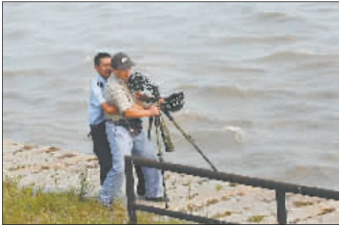
2008年9月3日,海宁,警察将摄影人“抱离”危险区域。