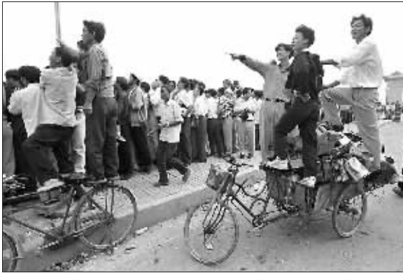
1997年9月19日,杭州九溪,由远而近的潮水,让观潮人群兴奋不已。