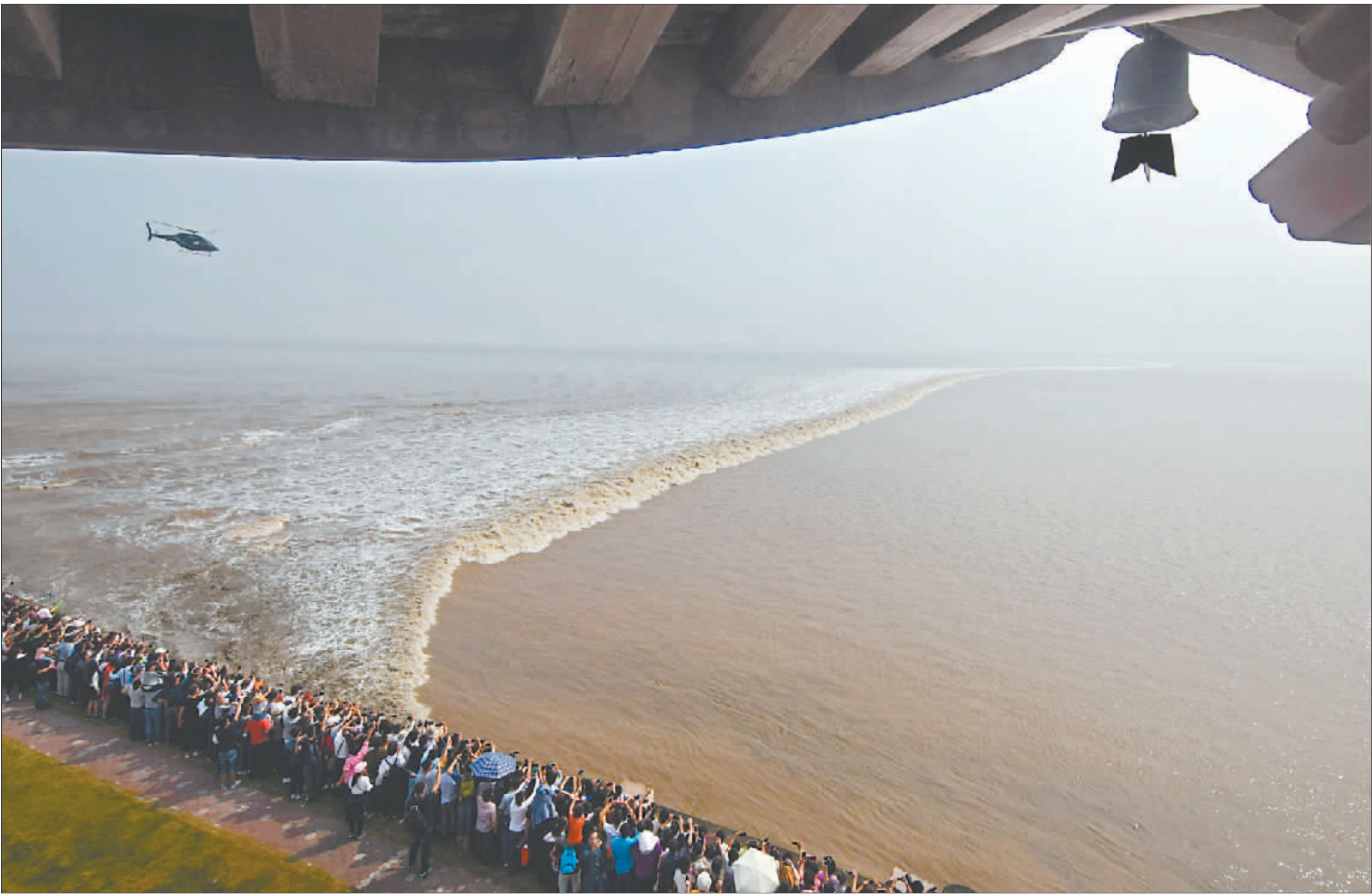
2017年10月7日,盐官,农历八月十八观潮日,数万人争睹钱江一线潮。

钱塘江大潮浩浩荡荡数千年,不变的是浪潮汹涌、声势浩大,变的是岸上的观潮者。20年来,从步行观潮到开私家车前来;从无序混乱到服务引导;从万人观潮到万人“摄”潮,百姓生活在这些点滴中不断变化。