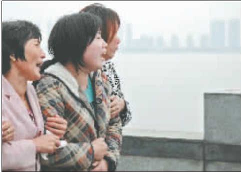
2010年10月11日,杭州萧山,4人被钱江潮卷走下落不明。