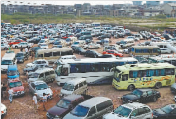
2005年9月21日,海宁,随着汽车普及,观潮客驾车到江边观潮。