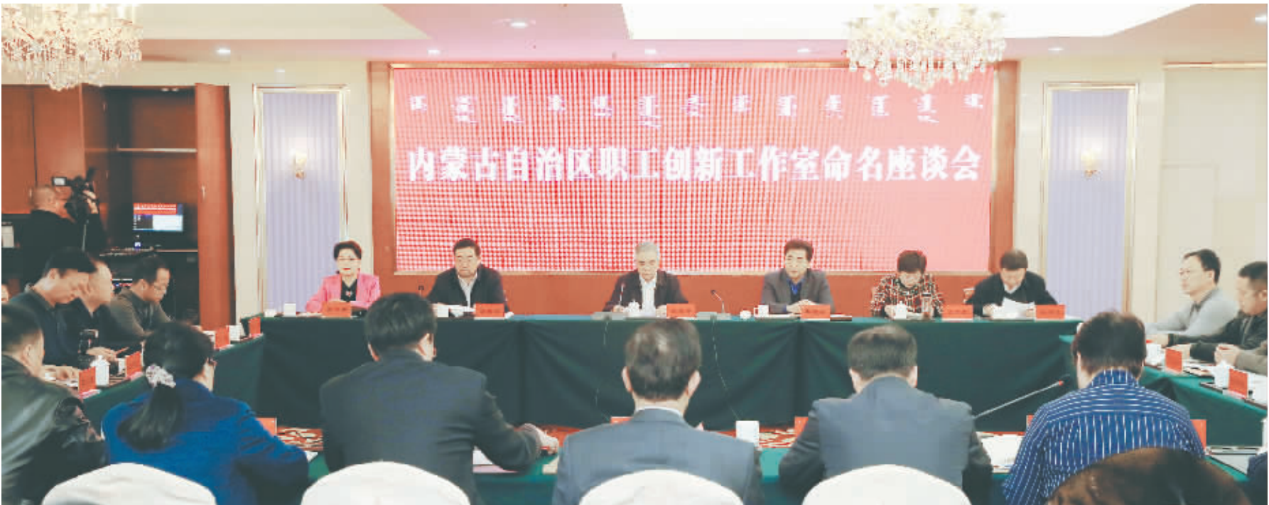
2016年12月9日,内蒙古自治区职工创新工作室命名座谈会召开

一项看起来不起眼的小发明、小创新,却可以为企业创造数量可观的经济效益;一个小小的技术攻关、技术创新成果,可以解决困扰企业生产的难题。 近年来,在内蒙古的一些企事业单位,由劳动模范、技术能手担任带头人的职工创新工作室正在不断涌现,并在引领职工技术创新、提升职工队伍素质、促进企业发展等方面发挥着重要作用。广大劳模以创新工作室为载体,积极投身于企业技术创新和人才培养。 内蒙古自治区总工会的资料显示,目前,内蒙古共建立职工创新工作室1164个,其中,3个被命名为全国首批劳模示范性创新工作室,130个被命名为自治区职工创新工作室。近3年来,自治区级职工创新工作室共确立创新课题2400多项,攻关项目850余项,涌现出创新成果1400余项,其中,推广应用成果1000多项,拥有发明和实用专利267项。创新工作室像一颗颗种子,分布在内蒙古大地上,成为万众创新的聚集地。