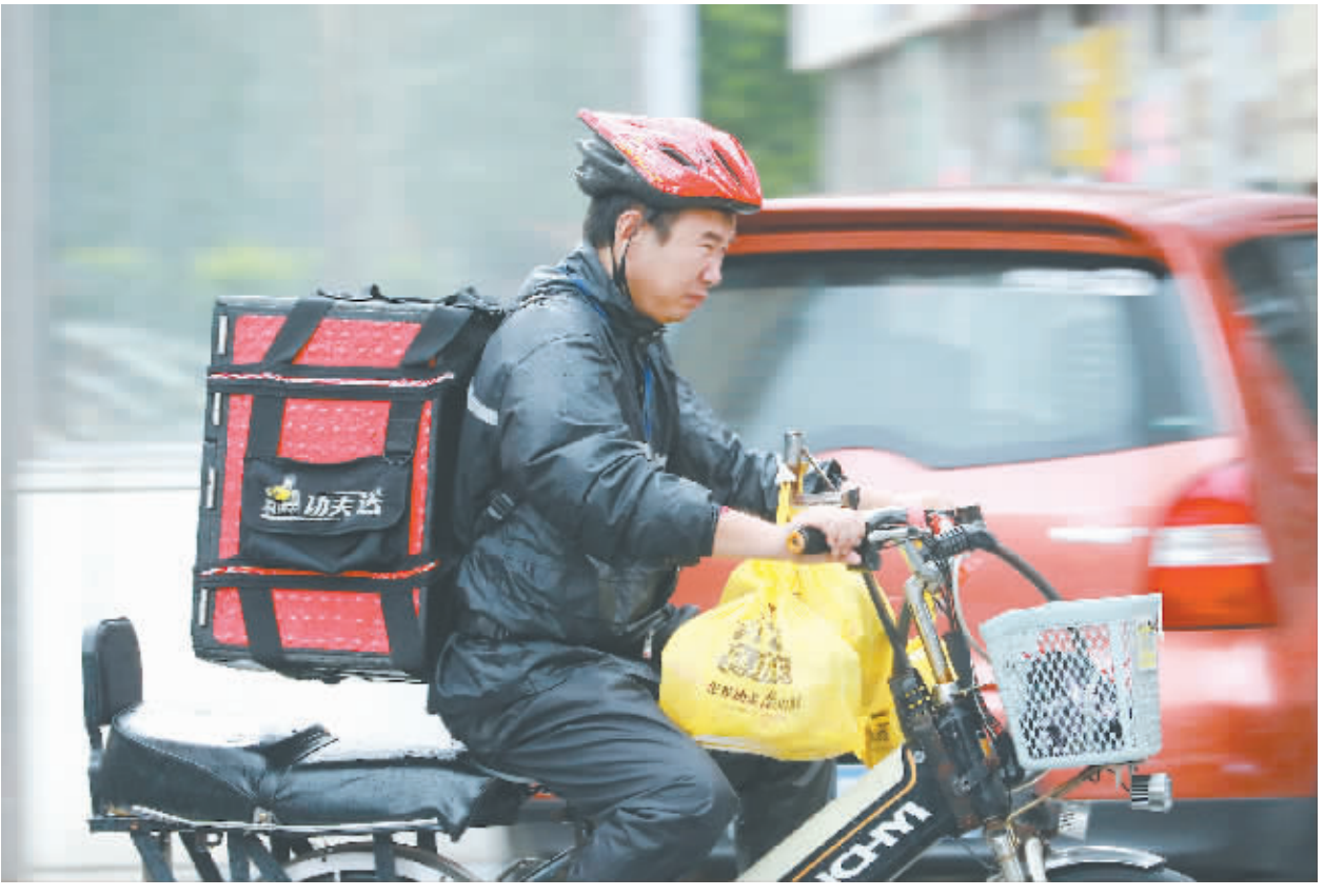
日前,台风“天鸽”逼近广东沿海,临近中午,外卖小哥“风雨兼程”送餐。

记者了解到,相当部分的送餐员从上午10点干到晚上10点甚至更晚。医疗卫生专业人士告诉