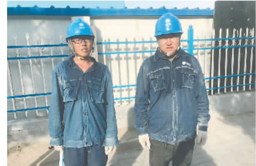
抢修人员整装待发

诚然,有关当下的论文考核评价制度以及论文本身的质量问题,讨论和质疑颇多,但即便是改革,也应对症下药,不能“捡到篮子里都是菜”。