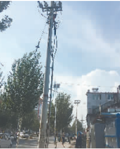
抢修人员在施工现场检查线路

由于当天的气温在42℃左右,柏油路已经被太阳晒得软软的,并且冒出了黑色的油漆,人在外面走一会儿,汗立刻就会流下来,像这种“鬼天气”谁都不想出去待一会儿,但是电力抢修人员此时此刻根本来不及多想,只想尽快找到故障点,在这炎热的天气给用电客户马上恢复送电。抢修人员首先去变压器跟前检查了一下,看看是否是用电客户说的变压器“爆炸”,在排除是变压器“爆炸”一说的可能之后,又经过了半个多小时终于找到了故障点,发现