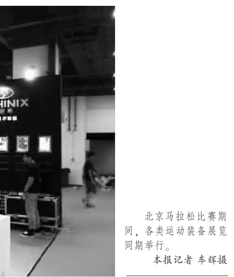
北京马拉松比赛期间,各类运动装备展览同期举行。

毫无疑问,城市马拉松发展至今,已经成为多个行业产业争抢的大蛋糕。除了坚守安全底线,一场马拉松赛事对城市交通、安保、环卫等基础配套的完善,志愿者服务等服务功能的齐备,组织方赛程、赛道规划都有极高的要求,只有进一步普及和推广马拉松的运动文化内涵,让健康科学的跑步运动成为习惯,城市马拉松才能越过狂飙突进的狂欢期,具备长久生命力,继而带动更多相关产业的健康发展。