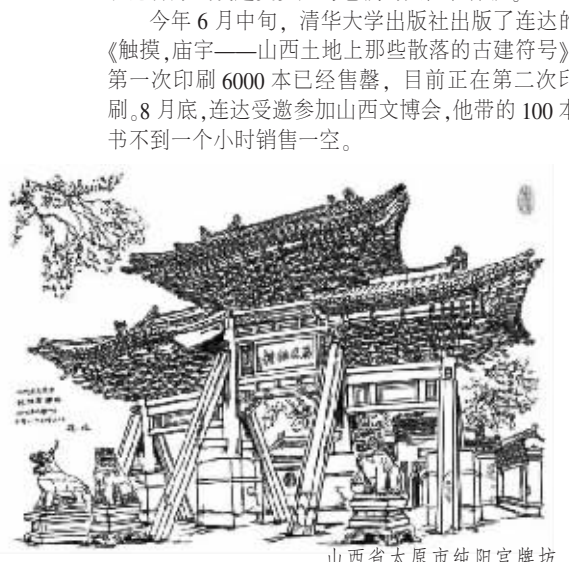
山西省太原市纯阳宫牌坊

之滨的山海关,一直走到了黄河拐弯处的老牛湾。期间,斗过野猪,挑过毒蛇,经历过悬崖绝境,战胜过寂寞孤独,我们的感情至今杠杠的。”