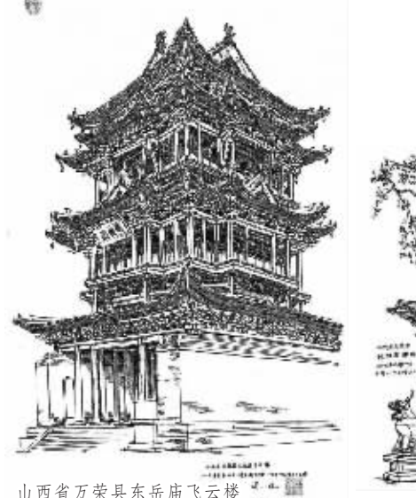
山西省万荣县东岳庙飞云楼

“我和我媳妇不仅仅是夫妻,也可以说是战友。年轻的时候,我俩一起徒步走过整个古长城,从渤海