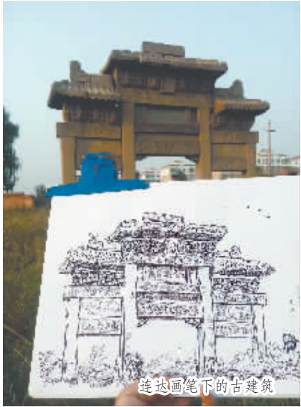
连达画下的古建筑