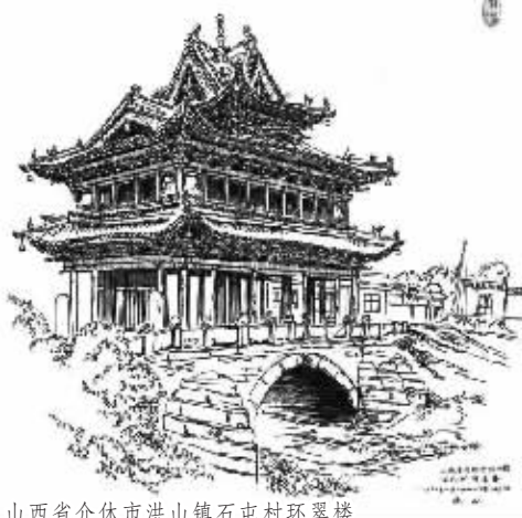
山西省介休市洪山镇石屯村环翠楼

为了节省费用,他尽量将一天的吃住和车票等一应花销控制在100元之内。他曾住过镇上的小旅