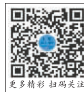
更多精彩内容扫码关注

互联网平台正在创造一个个新机遇,这其中孕育着希望,也存在着挑战。大浪淘沙,经过现实的检验,这些新职业的“成色”才能得到验证。