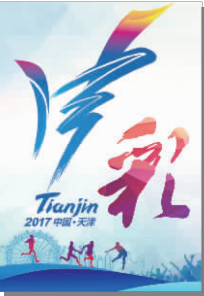
责任编辑:毕振山 梁凡 刊头设计:肖婕舒