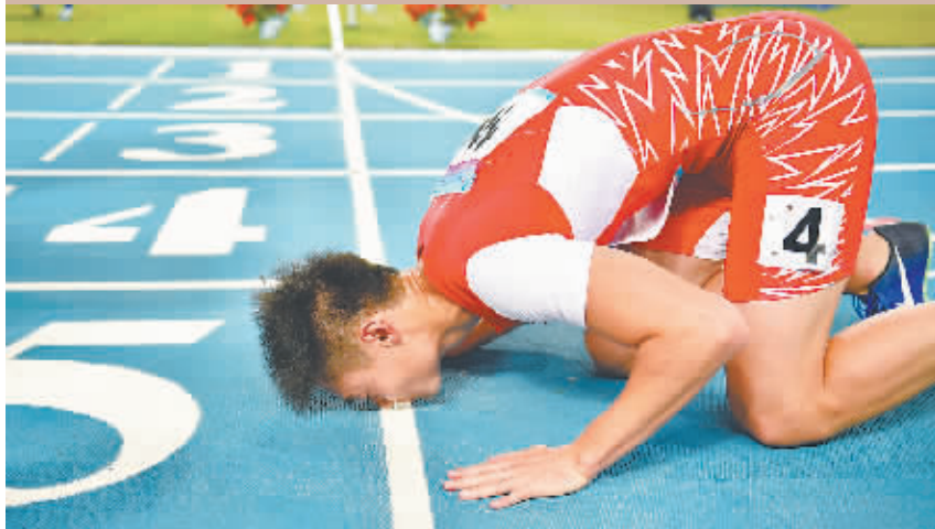
9月7日,张培萌在比赛后亲吻跑道。