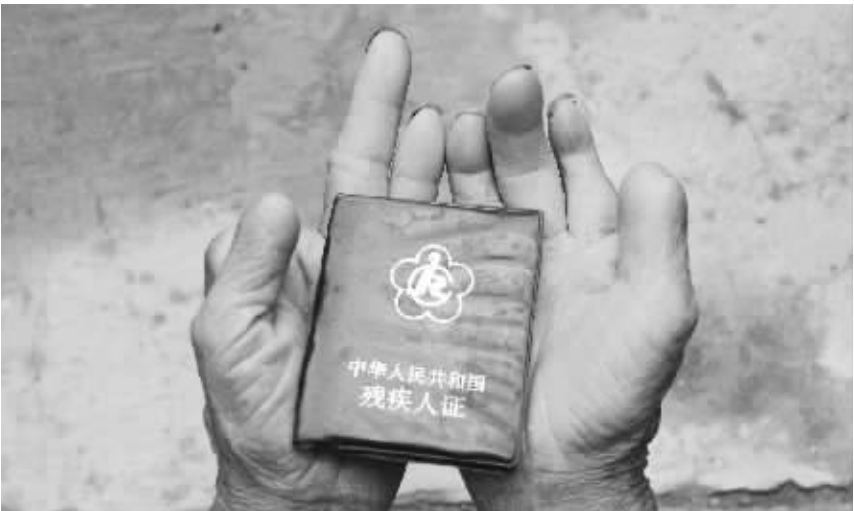
图为一农村残疾人和他的残疾证。截至2016年9月,农业户口残疾人中,贫困人口所占比例接近一半,残疾预防,在贫困人口中任务更艰巨。