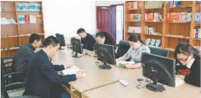
培育学习型员工,打造学习型企业