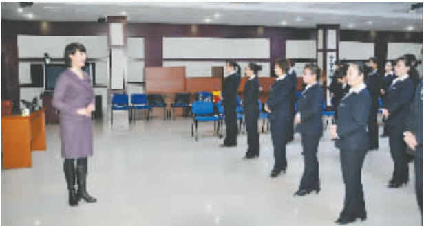
进行礼仪培训,提升窗口形象

重视线损管理,提升运行效益。开展理论线损计算,摸清线损真实情况,为线损考核提供合理的依据和参考;制定降损计划实施方案,成立由公司领导班子分片包抓的线损管理领导小组,进一步明确目标、夯实责任、包抓到底;严格抄、核、收制度,提高了抄表工作质量;合理调整配变容量,进一步核实并调整