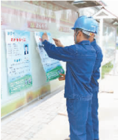
张贴服务指南,提升服务水平