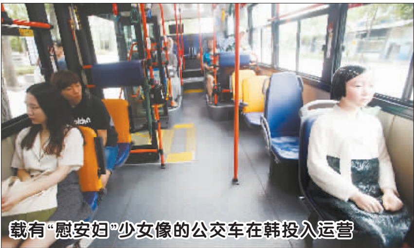
载有“慰安妇”少女像的公交车在韩投入运营

从以上民调结果来看,默克尔四度当选总理似乎胜券在握。在结束了夏季休假之后,默克尔于8月12日开启竞选日程,接下