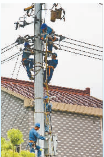
电力登高作业

“喜迎十九大,党员先锋行”主题实践活动硕果明显,在党员同志的先锋引领下,企业的进取意识、履职意识、服务意识进一步增强,“严”“实”作风进一步改进,员工素质能力进一步提升。东捷党员们在真学深悟的基础上,将把学习成果转化为崇高的觉悟境界、过硬的素质能力、模范的作风形象,为广大员工立起实做笃行的标准,以优异的成绩喜迎十九大的胜利召开。(龚柳 吴雁榕)