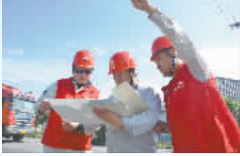
党员冲锋在一线

近日,申城热浪来袭,最高温度更是创145年之最。而有这样一群人,他们顶着烈日,挥洒着汗水,在高温的“炙烤”下,仍然在坚守,为区域发展、居民生活用电保驾护航。他们或许在如同烘箱的变电站,为了安装电力设备及调试工作待上一整天;他们或许身处毫无遮挡的郊区地块,汗流浹背地完成电缆的敷设;他们或许深夜到访居民小区,为家中断电的居民,重送光明与清凉。他们,就是东捷党员,“你用电,我用心”企业宗旨的勤劳践行者。