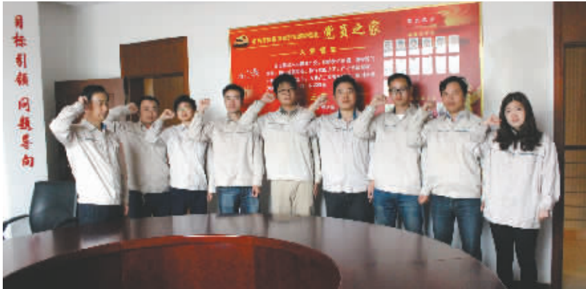
新党员入党宣誓仪式