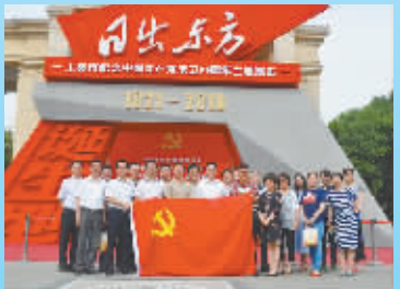
主题党日活动