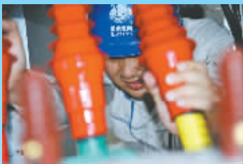
枫庭开关站

简介:上海东捷集团是隶属于国网上海市电力公司的一家集体企业,主要从事电力工程设备安装、电力工程设计、电力技术开发与研究,下设8个党支部,党员163人。