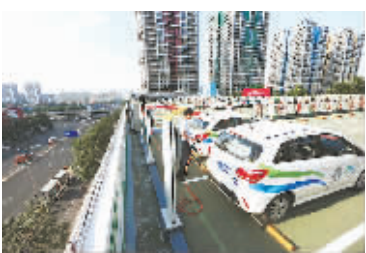
北京 CBD 建首座空中充电站