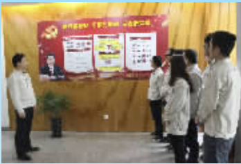
学系列讲话 做合格党员