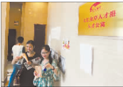
武汉首批大学生人才公寓交付使用