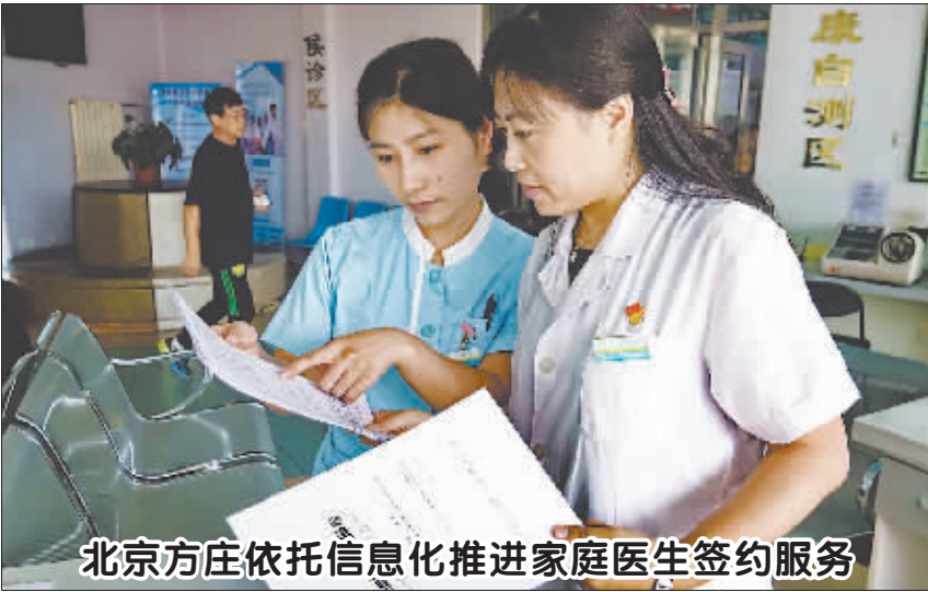
北京方庄依托信息化推进家庭医生签约服务

目前,北斗系统正在高精度定位和减灾救援方面实现对GPS的超越。有专家指出,这将是北斗导航实现弯道超车的突破点。