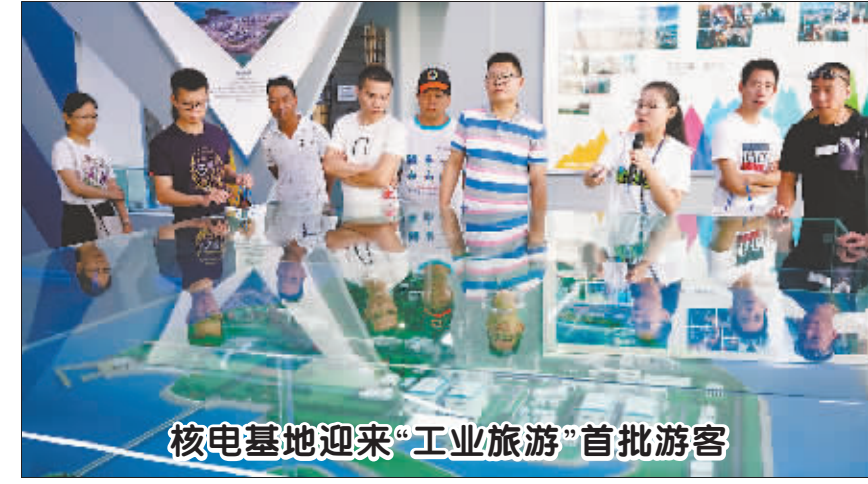
核电基地迎来“工业旅游”首批游客

为深入论证申请材料取消后的实施效果,研究相关精简标准能否进一步推广、复制,日前,质检总局在京召开精简和规范“重要工业产品生产许可证核发”申请材料论证会,征求法学专家、行业专家、生产企业代表、行业协会代表等各方意见。 代表们普遍认为,精简申请材料,不仅极大地便利了行政许可申请人,也有助于让监管部门把精力更多地投入到事中事后监管上来。