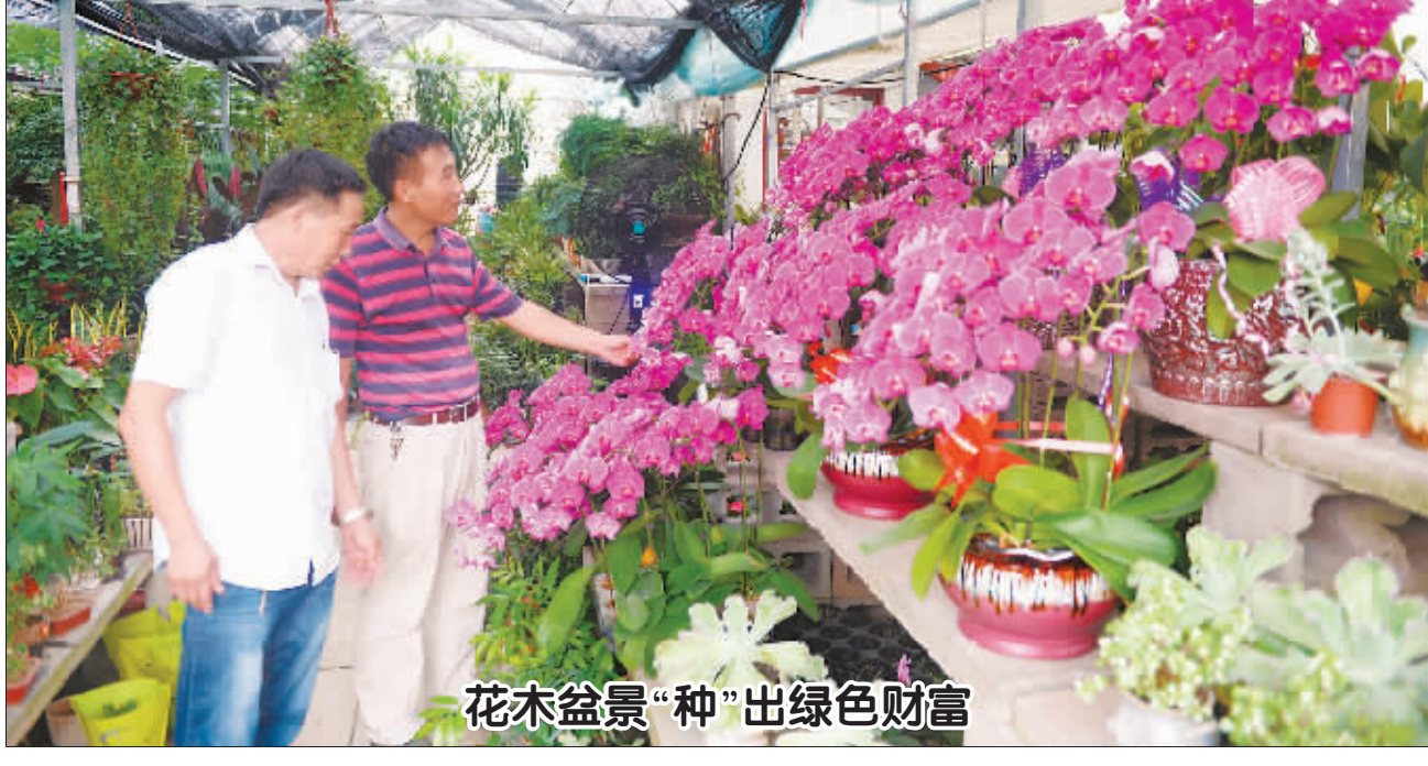
花木盆景“种”出绿色财富

8月7日,慕名前来的顾客正在顾庄村智能电力恒温大棚内选购花卉。 江苏省如皋市顾庄村享有“全国最美乡村”称号,这里家家种花木,户户扎盆景,村民