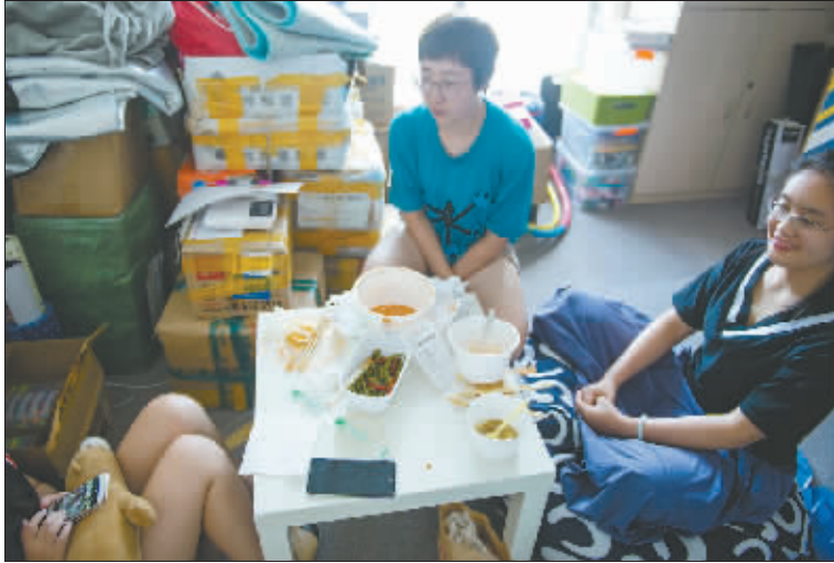
8月3日,机构位于东直门公寓里,做饭不便,大伙儿的午餐基本靠外卖。