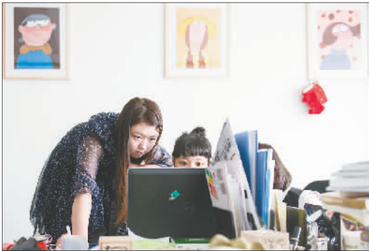
8月1日,机构的工作人员带着一名实习生在设计新学期的艺术课程教材。