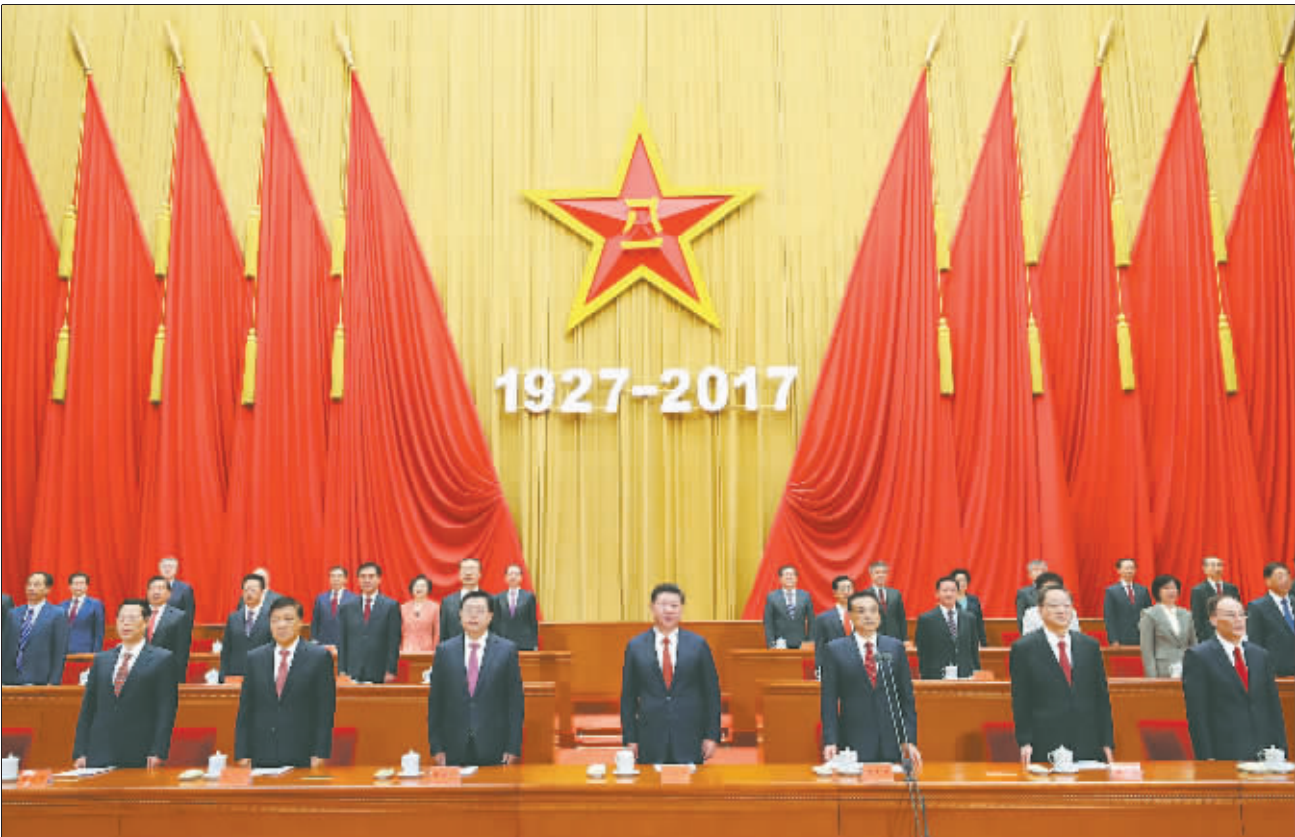
8月1日,庆祝中国人民解放军建军90周年大会在北京人民大会堂隆重举行。中共中央总书记、国家主席、中央军委主席习近平和李克强、张德江、俞正声、刘云山、王岐山、张高丽等出席大会。