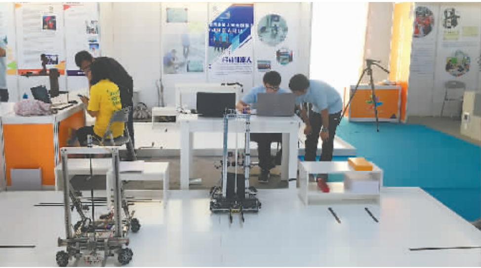
“技能中国行2017——走进云南”活动现场特别设置了开放式竞赛展区。

几条机械焊接手臂有节奏地运动着，几个年轻面孔则在一旁“辅助”处理零配件，这幅人机互动的画面并不是出现在制造企业的车间里，而是在云南技师学院的智能制造实训中心。 在2016年，我国工业机器人安装量达8.5万台，同比增长28.7%。机器人产业蓬勃发展的背后，是估计超百万的人才缺口。 嗅到市场需求的变化，云南技师学院从2011年开始，在智能制造工程系新增了工业机器人专业。智能制造工程系副主任李永红介绍说，这个专业涉及机械、电气、信息化等多种课程，培养的学生既懂得传统技能操作，也了解信息化知识，是能适应复合岗位需求的“多面手”。 “随着工厂引进工业机器人，不少工人被迫转岗或进行技能提升。而工业机器人专业将培养过程前置，更好满足了市场需求。”李永红告诉记者，这个专业近几年一直是报考的大热门。