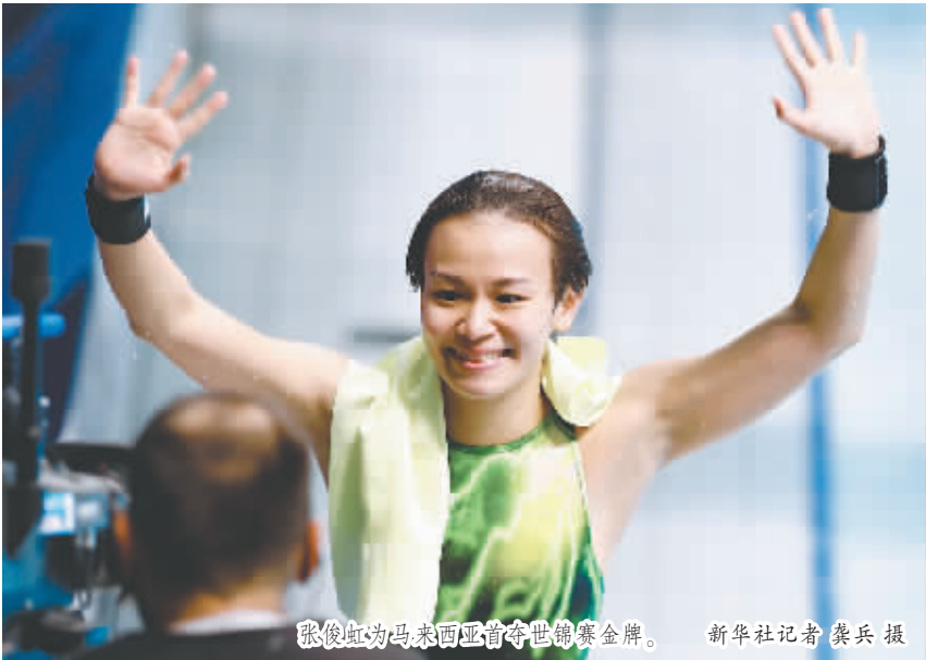
张俊虹夺马来西亚首枚世锦赛金牌。

梁还不是第一个前往马来西亚执教的中国教练。最早的是刘继客,在她的帮助下,马来西亚逐渐建起了跳水队。 此后,经过周希洋、杨祝梁等几代中国教练的努力,马来西亚跳水队逐渐在世界大赛上崭露头角。2009年世锦赛上,马来西亚在女双10米台首次获得奖牌,伦敦奥运会和里约奥运会均有马来西亚跳水运动员登上领奖台。这一次,马来西亚队首次在三大赛斩获金