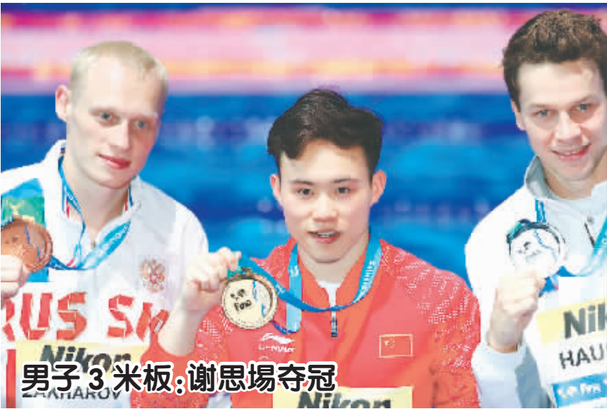
7月20日,获得金牌的中国选手谢思埸(中)、获得银牌的德国选手豪斯汀(右)和获得铜牌的俄罗斯选手扎哈洛夫在颁奖仪式上合影留念。 当日,在匈牙利布达佩斯举行的第17届国际泳联世界游泳锦标赛跳水项目男子3米板决赛中,中国选手谢思埸以547.10分的总成绩获得冠军。

声音 刘颖余 大学期间,读过一本书,外国人写的,写的什么忘得差不多了,但名字印象深刻,叫《必要的舍弃》。后来的岁月里,不顺或失意的时候,我常常想起这五个字,心情果然就好了不少,就像真的喝了“心灵鸡汤”一样。 这样的“心灵鸡汤”其实也没什么了不起的,中国不乏类似的人生哲学智慧,什么“有舍才有得”“失之桑榆,收之东隅”“塞翁失马,焉知非福”“将欲取之,必先予之”,说的都是得与失之间的微妙转换。道理不复杂,但关键是知易行难,尤其在当下这样一个欲望空前膨胀的时代里。 看到35岁342天的瑞士天王费德勒拿到人生的第19个大满贯冠军,我的天空里也飘过五个大字:“必要的舍弃”。 我不认为,现在的费德勒比鼎盛时期的他还出色,这并不符合竞技体育的规律。但现在的天王拥有更强的意志力,更旺盛的热情,更坚定的胜负心,最重要的是,他保持着身体百分之百的健康。就像网球名宿维兰德分析的那样:“以他现在的年龄,罗杰证明了在网球比赛中,身体并不是最重要的。意志力和热情才是重点。如果你有这个心,身体健康,那么25岁和35岁是一样的。” 而费德勒是如何保持健康的?寻找更省力的打法是一方面,另一方面更重要的是休息。去年整个下半年,费德勒都在休息,今年的红土赛季,他仍在休息,甚至放弃了法网。“不是每个球员都需要休息,有些运动员可能需要不断地去比赛,但对我来说,休息真的创造了奇迹。我仍然很惊讶它的效果。我必须在前进的道路上做出一些艰难的决定,比如退出法网、退出红土赛季,现在看来很简单,这些都是为了温网,但其实并不是。我只是需要在身体上百分之百地 必要的舍弃