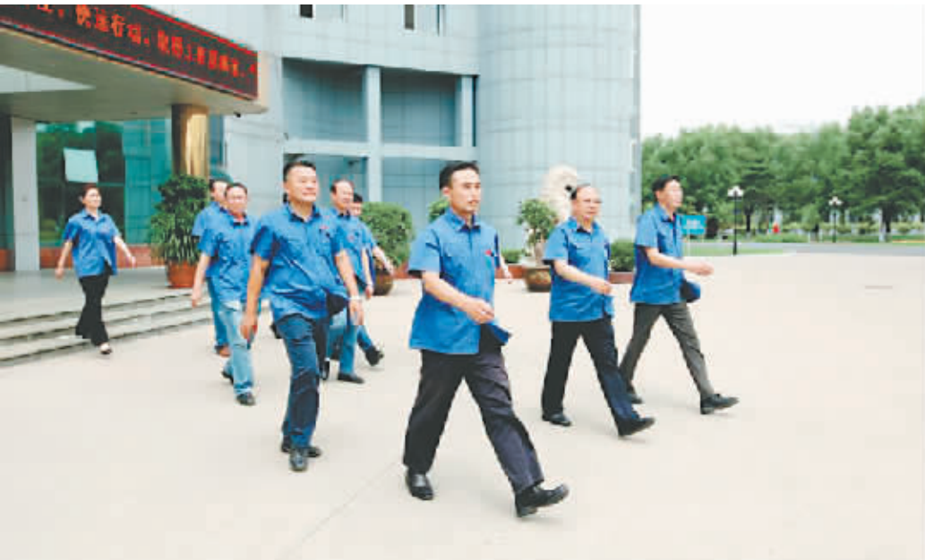
团结务实、开拓创新的领导班子集体

他结合公司发展需要，提出全力推进内控建设，不断查找关键风险控制点，制定相应控制措施，重新设计业务流程，陆续完善、修订了涉及企业组织架构、发展战略、企业文化、供产销、人财物等18项205个内控制度，建立了覆盖全部业务和部门的《内部控制管理手册》，为公司内部控制体系建设、运行和维护，提供了政策依据，统一规范和行动准则。在采购管理上，他倡导“既抱西瓜又拣芝麻”，紧跟市场节奏，合理控制库存临界点，把握时机实施比价采购和低价位采购，强化招、