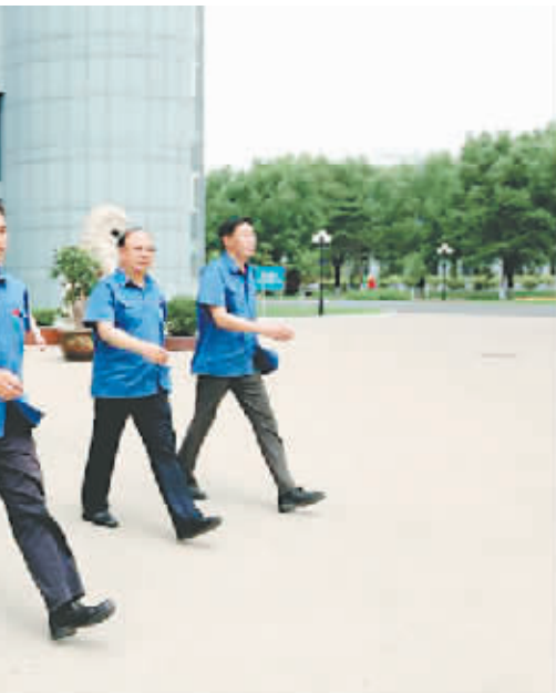
团结务实、开拓创新的领导班子集体

一系列创新技术改造极大地提高了工作效率，成为公司新的产业优化升级和经济持续增长的动力之