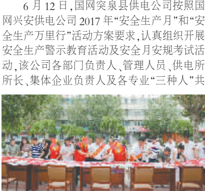
安全月百人签名活动

6月12日,国网突泉县供电公司按照国网兴安供电公司2017年“安全生产月”和“安全生产万里行”活动方案要求,认真组织开展安全生产警示教育及安全月安规考试活动,该公司各部门负责人、管理人员、供电所所长、集体企业负责人及各专业“三种人”共65人参加警示教育