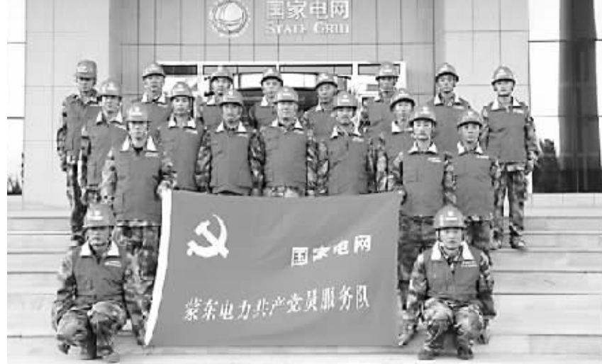
国网库伦旗供电公司运维检修中心共产党员服务队

“金杯银杯不如百姓的口碑，金奖银奖不如老百姓的褒奖。”凭借优质、高效、贴心的服务，运维检修中心共产党员服务队赢得了库伦大地客户的一致好评，“共产党员服务队”这面鲜红的旗帜，在美丽的库伦大地绽放耀眼光芒，永驻民心，永远飘扬。（朱莉）