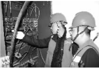
对供电设备进行检修