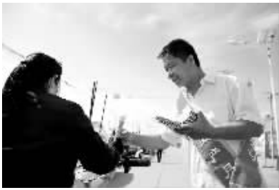
向客户发放宣传材料

去年国庆节前夕，清新线34号开关跳闸，清新线带旧木线，清新线42号隔离刀闸烧断，这意味着将面临大面积停电，直接影响到多个企业及工厂正常运行。为全力减少客户的损失，服务队的