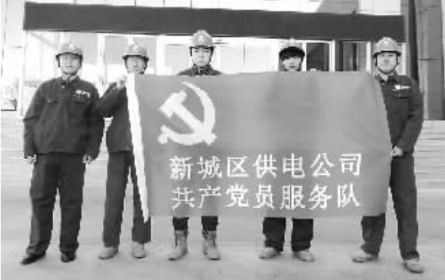
国网新城区供电公司共产党员服务队

国网新城区供电公司共产党员服务队成立以来，就明确目标，规定共产党员服务队要在公司党委的领导下开展活动，负责组织和实施本公司以党员为主题的各项服务活动。自服务队成立以来，出动服务队数十次，为辖