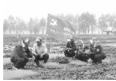
党员服务队深入田间助春耕

一直未用上电，家中至今仍然使用煤油灯和蜡烛照明，生活十分不便。党员服务队员得知情况后，立即向公司领导汇报，领导高度重视，为老人开辟绿色通道，服务队第一时间到现场进行勘察，准备材料，为老人架设线路、装表接电、安装刀闸等用电设施。经过两个多小时的紧张施工，为老人家里点亮了爱心明灯，开灯的那一刻，大家看到老人的脸上露出了久违的笑容。