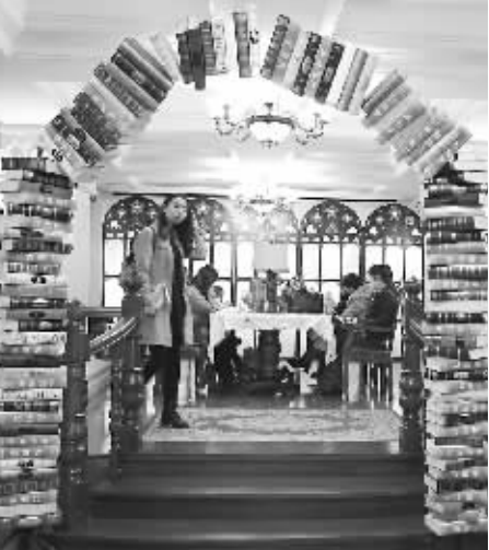
哈尔滨果戈里书店内部。