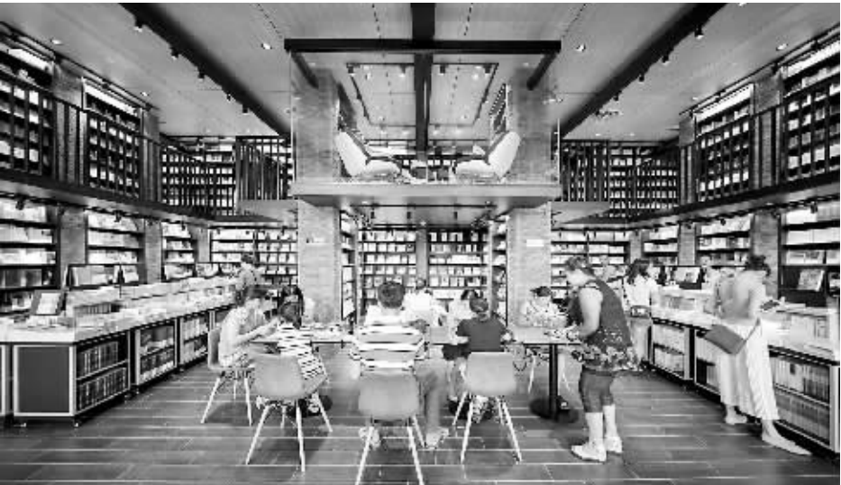
四川成都钟书阁书店内景。

一些“网红书店”还选择和旅店搭配在一起。2016年1月,国内某房屋平台开始与多个城市的实体书店合作,推出“城市之光”书店住宿计划。这个计划推出至今,已有14个城市的16家书店加入,其中超过一半的书店实现了短租盈利,并抵消了经营成本。上海mephisto书店是最早加入“城市之光”计划的,该书店创办人介绍,书店去年短租收入在16万元左右,可以覆盖书店支出,并