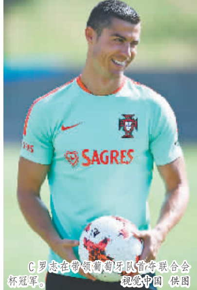
C罗在带领葡萄牙队备战联合会杯冠军。

从1997年到2013年,联合会杯共举行了7届,其中巴西队4次夺冠,法国队两次夺冠,墨西哥队也拿到一次冠军。本届比赛,虽然德国队“我行我素”不派主力阵容,但葡萄牙、智利等强队还是召集了大部分主力球员。其中,葡萄牙队的C罗、佩佩等