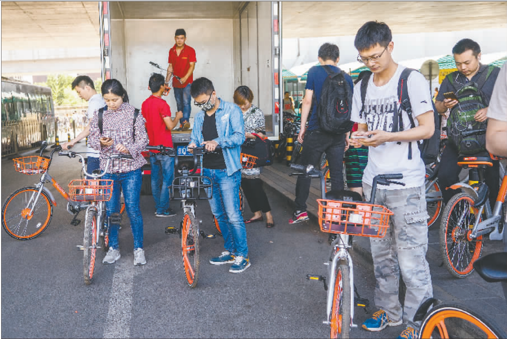
北京的一些地铁口成了共享单车公司投放车辆的必争之地。5月24日上午,正值上班高峰时段,新到的一批摩拜单车(共享单车品牌)被上班族直接从货车上取下骑走。

6月5日傍晚,站在北京后海边的胡同口,老单嘬了一口烟,操起一句京片子:“这车夠多夠多的,都快成灾了!”