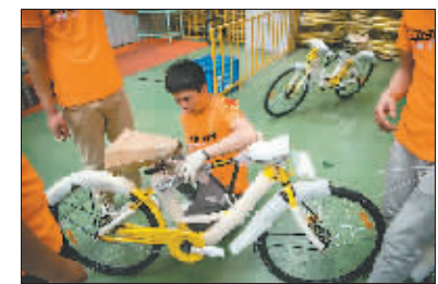
5月19日,天津飞鸽自行车厂车间,几名工人正在为一辆即将出厂的小黄车包裹防撞垫。自从共享单车面世以来,一批老牌自行车厂迎来了新的机遇。

在这股共享单车的潮流中,各方角力,舆论喧嚣。从制造者到骑行者,从高楼丛林到胡同小巷,从年轻的创业者到广场大妈,它像一条毛细血管,在打通城市最后一公里的同时,也在构建围绕它的社会生态。