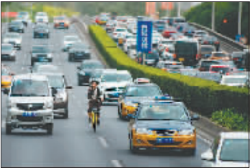
上图 5月23日,北京中关村,人们骑着共享单车穿行在繁忙的十字路口。