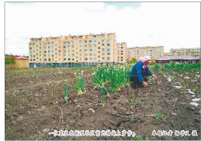
一位农民在新社区前的耕地上劳作。