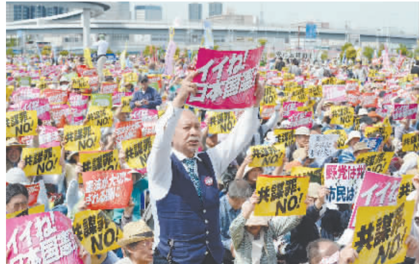
当地时间5月3日,日本民众在东京参加集会,纪念“和平宪法”颁布70周年,抗议安倍政府的修宪企图。

宪,高于支持的45%。根据日本修宪相关程序,修宪动议首先需要分别得到国会众议院和参议院三