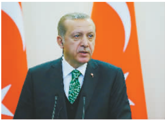
土耳其总统埃尔多安

自4月初叙利亚化武装袭击事件导致俄罗斯与西方关系恶化以来,叙利亚局势进入相对平静期。然而表明上的平静却可能孕育着更大的变数,土耳其、以色列纷纷介入,俄罗斯与西方国家则在尝试进行沟通……随着阿斯塔纳和谈第四轮会谈的举行,各方围绕在叙利亚设立安全区问题又将展开新一轮博弈。