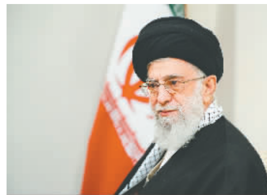
伊朗最高领袖哈梅内伊