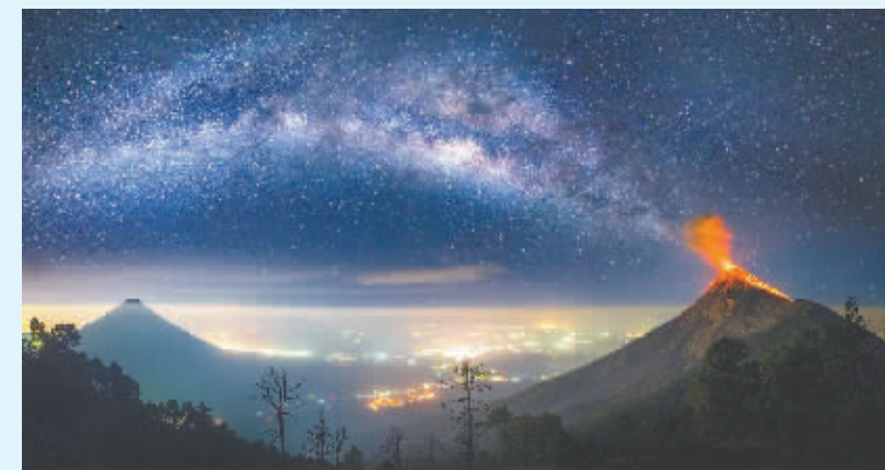
据外媒5月2日报道,摄影师艾伯特拍摄到危地马拉火山喷发的震撼画面,其中一张照片中,他捕捉到银河与火山惊喜同框的画面。