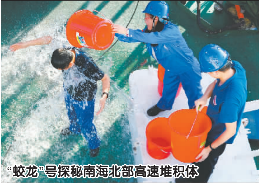
“蛟龙”号探秘南海北部高速堆积体

据悉,宁夏将完成12座县级以上城镇污水处理厂提标改造,实现全区现有34座城镇污水处理设施全部达到一级A排放标准,新建生活污水处理设施全部执行一级A排放标准。开展地级城市集中式饮用水源地规范化建设,组织吴忠、中卫等地开展备用水源或应急水源建设,依法清理水源保护区内违法建筑和排污口,搬迁或关闭保护区范围内规模化畜禽养殖场,确保饮用水安全。