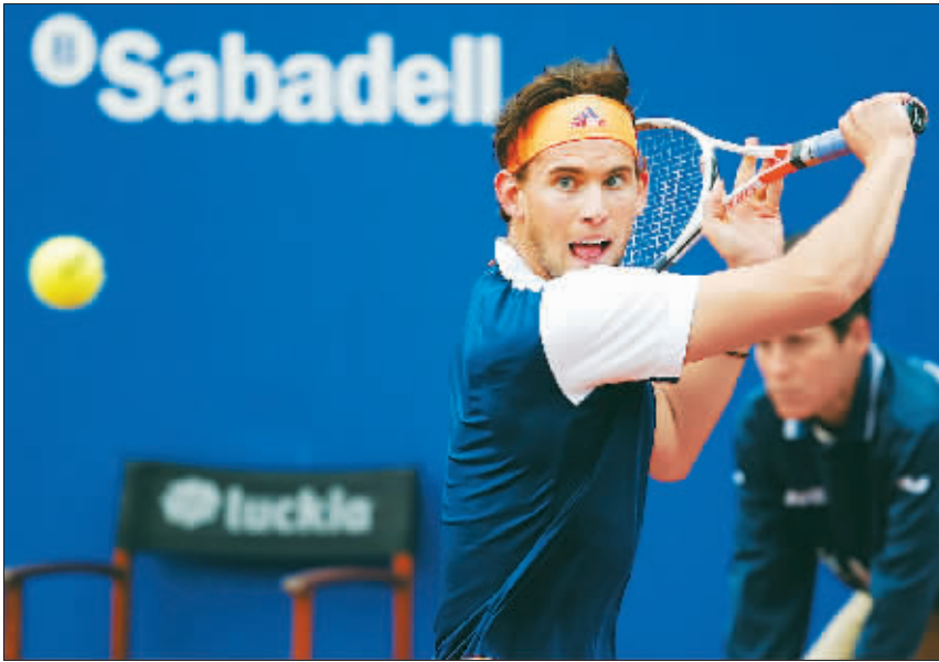
巴塞罗那公开赛：纳达尔夺冠 4月30日，蒂姆在比赛中回球。当日，在巴塞罗那网球公开赛男单决赛中，西班牙选手纳达尔以2比0战胜奥地利选手蒂姆，获得冠军。

赛季开始以来表现抢眼的广州富力，即便没有亚冠赛事，也要力争在中超和足协杯的双线作战中延续强势。 赛季前引援动作不大、整体投入保持“低调”的富力，堪称本赛季中超的“黑马”。中超开赛前6轮5胜1平保持不败，上轮输球后依然和恒大一起并列积分榜首，斯托伊科维奇对于球队的改造可谓渐入佳境。不过，未来3周时间将是对富力的一大考验：他们先是在足协杯中迎战中甲劲旅青岛黄海，随后还要在中超赛场连续对阵山东鲁能、华夏幸福、北京国安和上海申花等劲旅。阵容厚度一般的富力如何在双线作战中力争佳绩，想必斯托伊科维奇要好好动一番脑筋。 前国脚于根伟在接受采访时认为，如何打好多线比赛一直是中超球队的“软肋”，“目前大多数中超强队之所以不愿意轮换，除了成绩压力，更主要还是后备阵容尤其是年轻队员的成长缓慢。如果球队整体实力不够，如何应对多线赛程肯定需要权衡。”