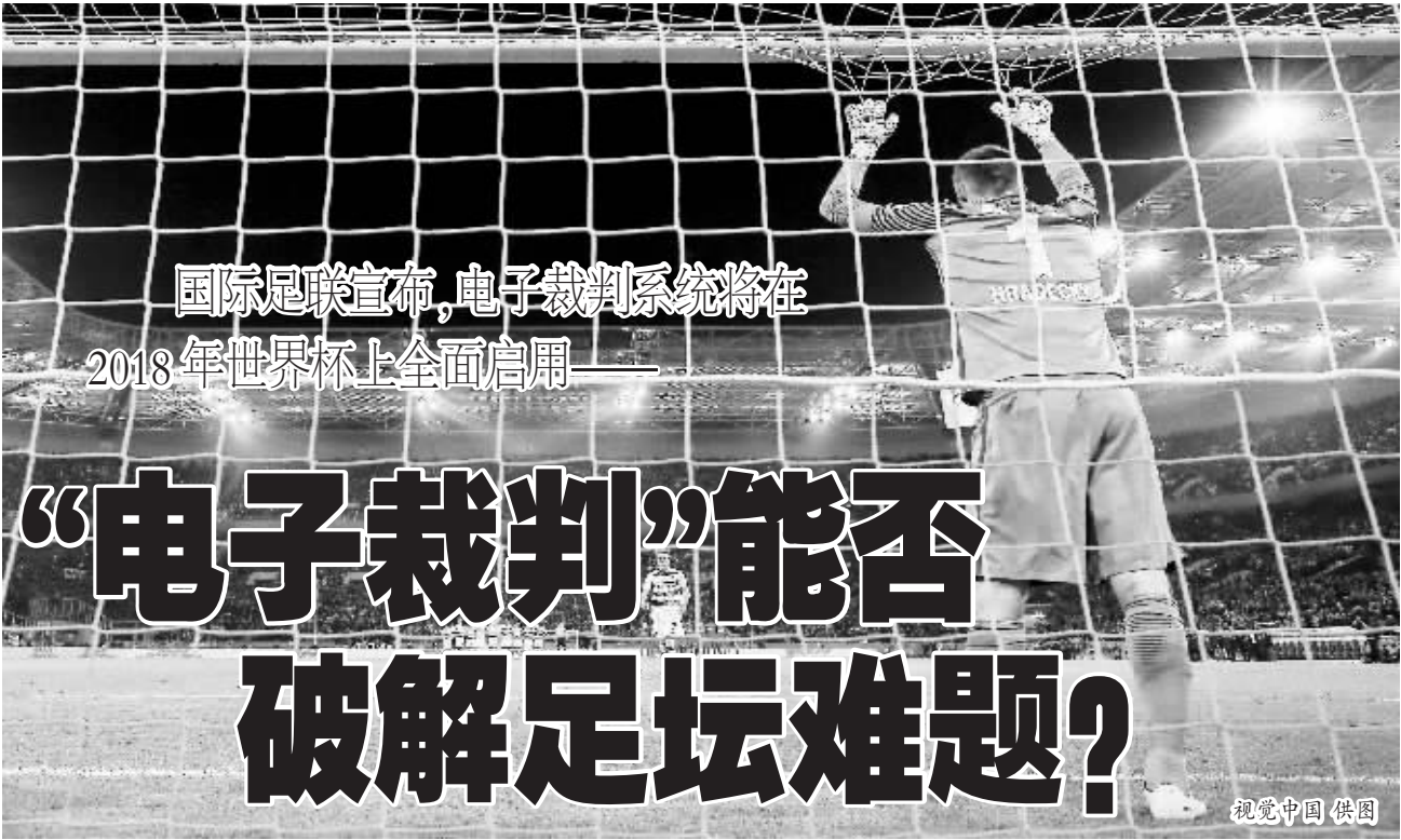
国际足联宣布,电子裁判系统将在2018年世界杯上全面启用——