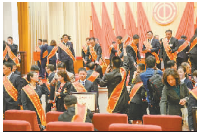
大会结束后,代表们纷纷起身走到台前合影留念。