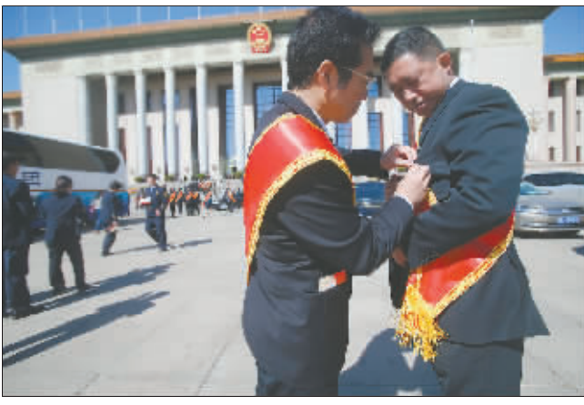
两位代表在步入会场前整理绶带。