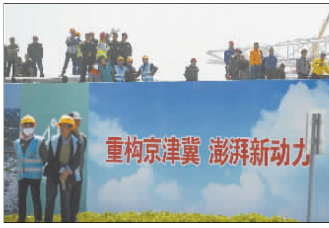
北京新机场建设工地的工友们在观看庆祝“五一”国际劳动节心连心特别节目。