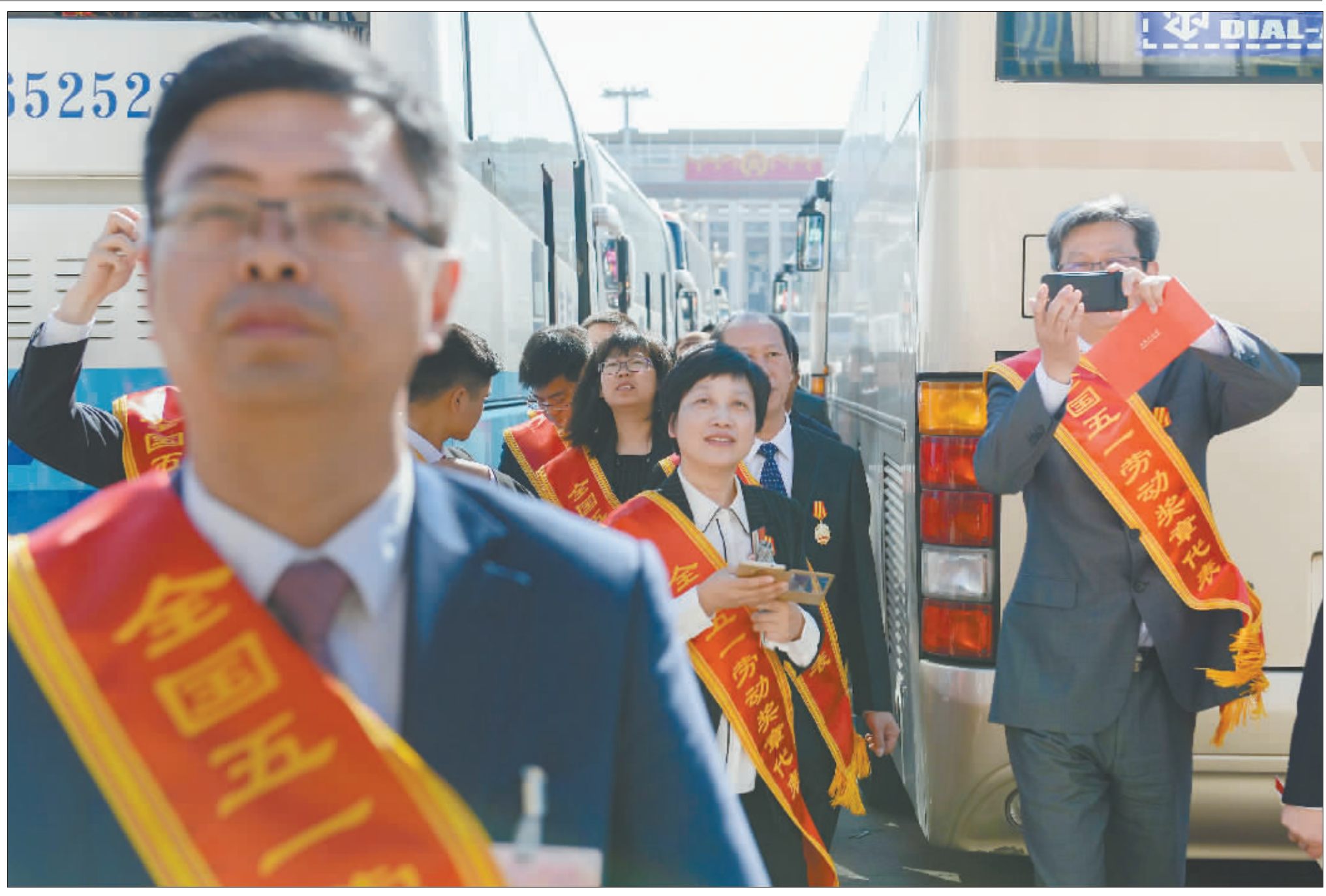
4月27日上午,受表彰代表乘车抵达人民大会堂,他们中的许多人都是第一次来到这里。当日,2017年庆祝“五一”国际劳动节暨全国五一劳动奖和全国工人先锋号表彰大会在北京人民大会堂举行。