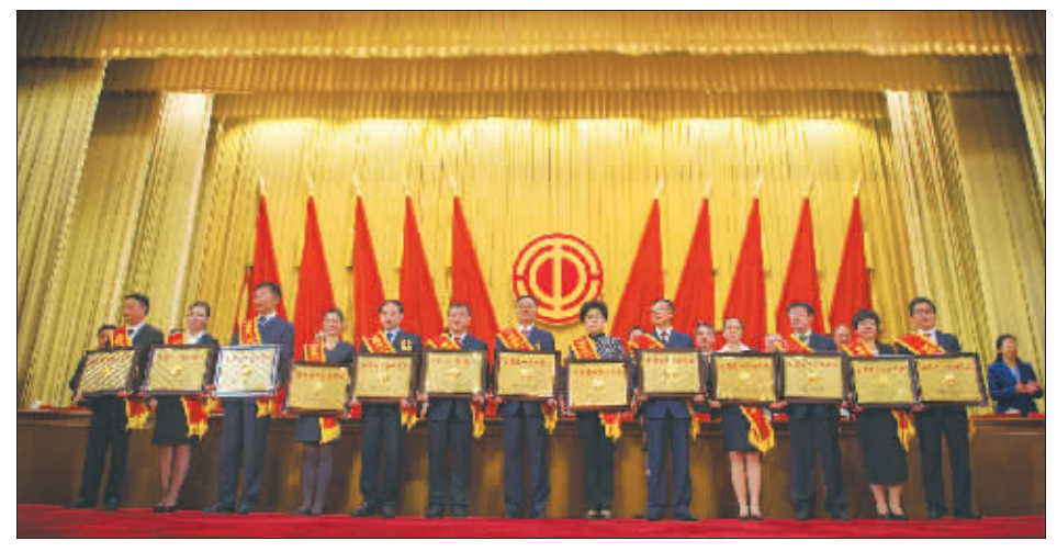
4月27日上午,全国五一劳动奖状获奖单位代表上台领奖后合影。