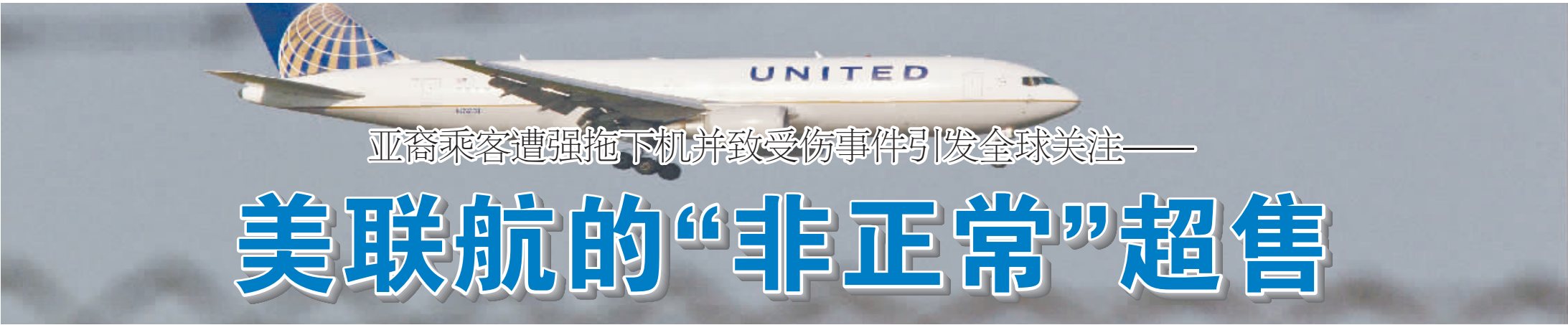
压题图:美国联合航空公司的客机。