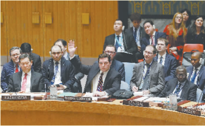
4月12日,在位于纽约的联合国总部,俄罗斯常驻联合国副代表萨夫龙科夫(前中)在安理会上就英美法三国起草的叙利亚化学武器问题决议草案进行表决时投反对票。

当天早些时候,联合国秘书长叙利亚问题特使德米斯图拉向安理会通报情况时说,叙利亚局势当前面临极大风险,国际社会应团结一致,全力支持联合国主导的叙利亚和谈进程。他表示准备在5月重启叙利亚问题日内瓦和谈。