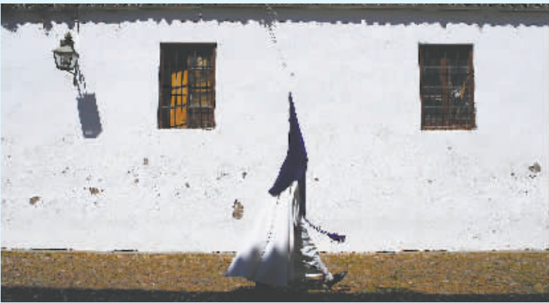
当地时间4月11日,西班牙科尔多瓦,当地举行圣周游行活动,信徒穿着过膝长袍,头戴又尖又长蒙面帽游行。阴森诡秘的服饰增添了圣周的神秘感和庄严感。