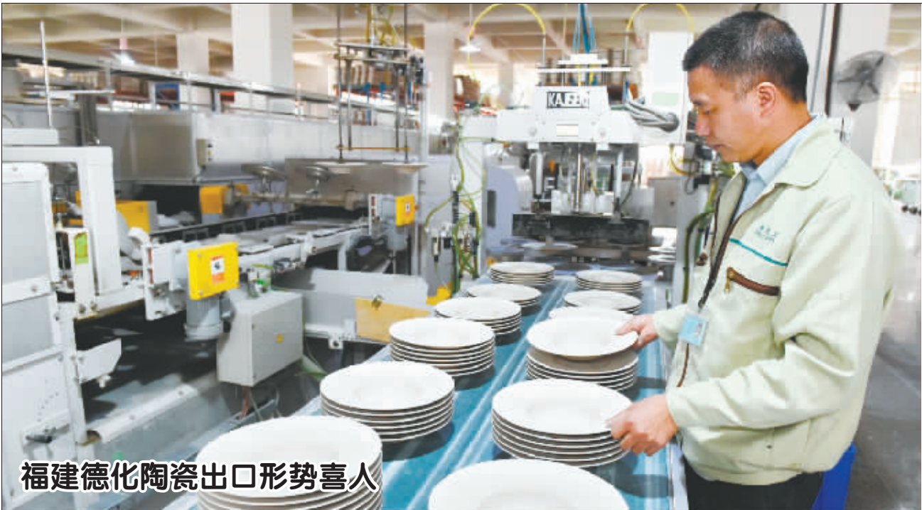
福建德化陶瓷出口形势喜人 4月12日,福建德化协发光洋陶器有限公司的工作人员在陶瓷自动化生产线上检查餐盘坯体。 福建省泉州市德化县有陶瓷企业2600多家,2016年陶瓷产值199.5亿元人民币,其中出口陶瓷137.64亿元人民币,产品销往泰国、法国等190个国家和地区。

从今年1月开始,兰州主城区四区公安运管机构专门成立了“打非办”和三县一区运管所同步开展非法营运车辆整治行动,扩大整治面,确保整治效果,加强人流密集区域非法营运车辆打击力度。“黑车”猖狂营运的势头虽然得到一定程度的收敛,但并未根本绝迹。