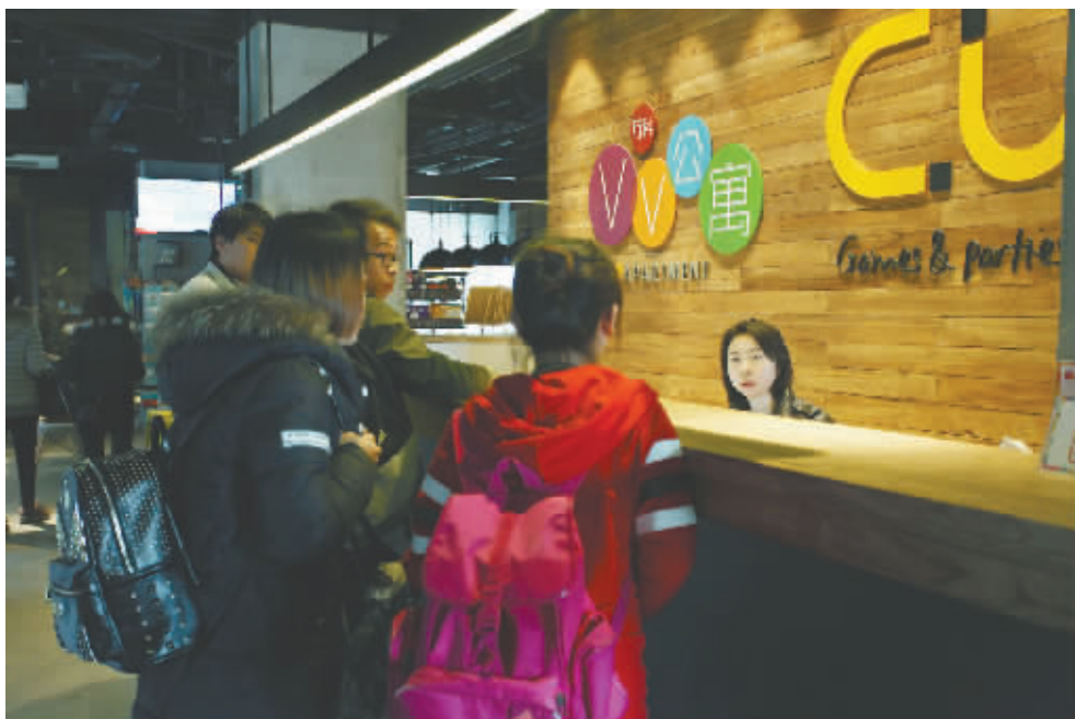
陕西西安新型出租公寓受年轻人青睐。

越严格,具备购买能力的人慢慢减少,购房年龄将会延迟,这会导致越来越多的人需要在租赁市场停留更长的时间。”链家研究院杨现领认为。