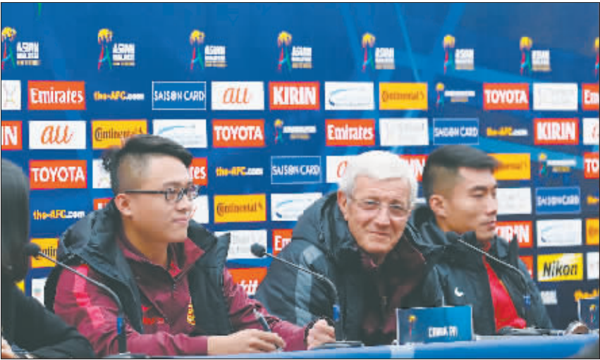
3 月 22 日,中国队主教练里皮(中)在长沙贺龙体育中心参加新闻发布会。

长沙缠绵了几天的春雨终于在今天中午逐渐停止,紧张备战世预赛 12 强赛中韩之战的中国男足,在贺龙体育场外场进行着赛前的最后一堂训练课。将在北京时间 3 月 23 日晚打响的这场关键之战,是国足在今年的首场正式比赛,其结果也将关系到中国队还能否在 12 强赛中保留晋级希望。 “中国队如果还想继续活着,就必须拿下