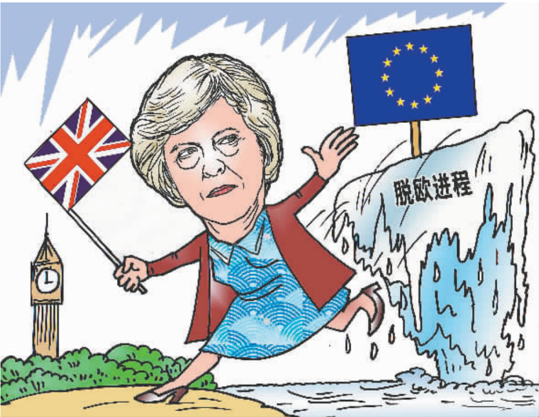
3月13日,英国两院正式授权首相特雷莎·梅启动脱欧进程。

格兰正站在“非常重要的十字路口前”,亟须在跟随英国“硬脱欧”和成为独立国家之间作出抉择。