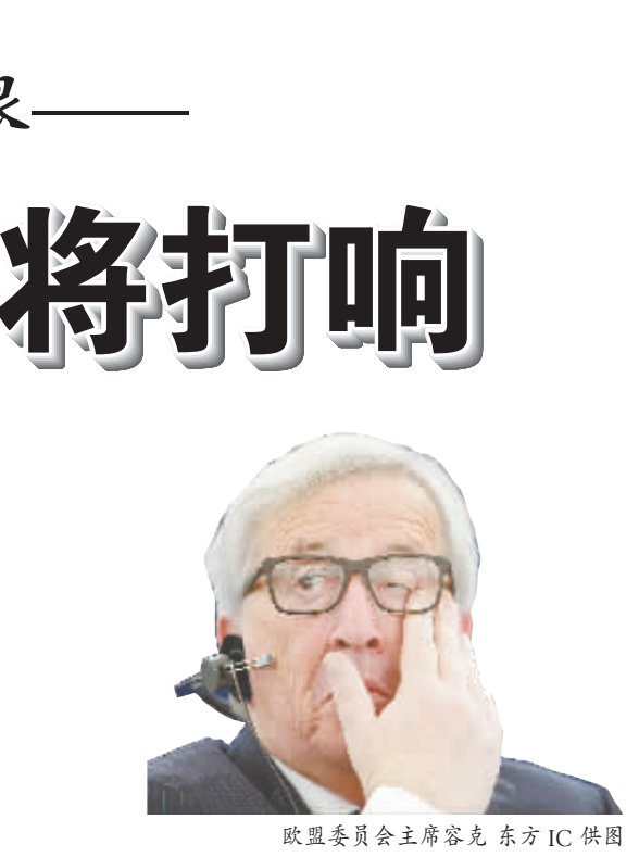
欧盟委员会主席容克