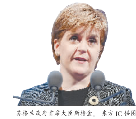
苏格兰政府首席大臣斯特金。