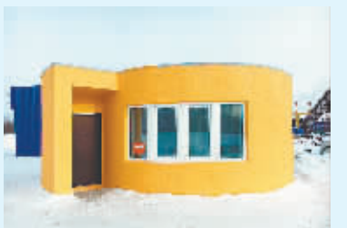
据外媒3月14日报道,美国旧金山的阿比斯科技公司用移动3D打印机在24小时内建成了一座房子。