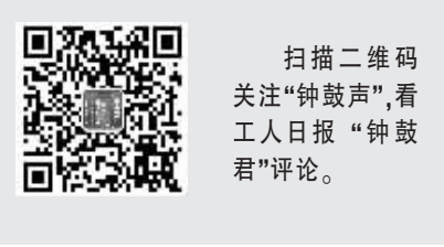
扫描二维码 关注“钟鼓声”,看 工人日报“钟鼓君”评论。

销程序。同时进一步完善相关法律法规,建立企业定期监测通报制度,加大对隐瞒真实情况、弄虚作假行为的打击力度。 在中国经济处于转型换挡期的今天,产能过剩和需求结构升级的矛盾愈发突出,唯有持续深化改革,敢于打破固有的思维束缚和体制机制障碍,才能将“影子企业”“僵尸企业”这类阻碍市场经济发展和市场活力释放的“变异体”彻底清除,从而促使一个充满活力、健康有序的市场格局的形成。