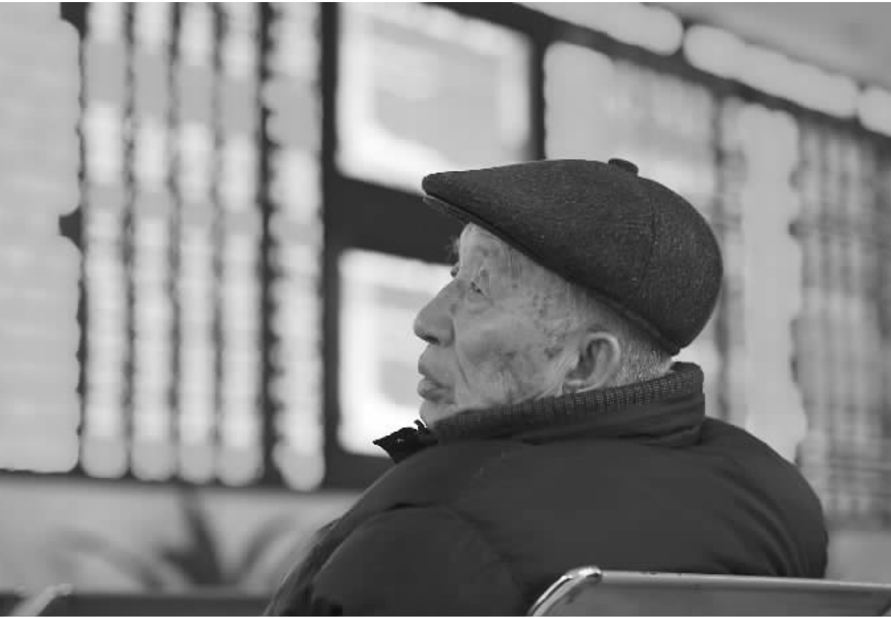
2016年12月26日,安徽省阜阳市,股民在一家证券营业部内关注股市行情。

张双宁和妻子在河北省同一家国有银行上班,安稳的生活让张双宁对投资有了想法。张双宁一直对股票情有独钟,在他的印象中,那是一种“一夜暴富”的方式,加上那一年的3月到5月,上证指数狂飙1000多点,一向谨慎的他再也没按捺不住情绪,将自己的积蓄